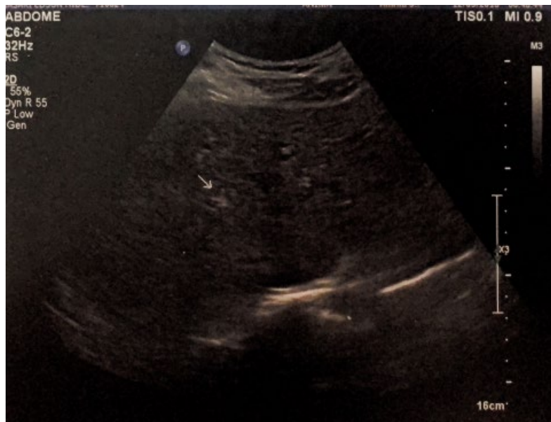
Figura 1 - Primeira USNG – fígado com áreas hiperecoicas focais e esparsas.

Após análise dos exames supracitados os resultados foram: hemograma normal; glicemia de jejum = 95mg/dL (VR: 70-99mg/dL); Colesterol total = 199mg/dL (VR: abaixo de 200 mg/dL), HDL (lipoproteína de alta densidade) = 50mg/dL (VR: acima de 40mg/dL), LDL (lipoproteína de baixa densidade) = 130mg/dL (VR: abaixo de 130mg/dL); Triglicérides = 86mg/dL (VR: abaixo de 100mg/dL); Ureia = 29mg/dL (VR: 10-45mg/dL); Creatinina = 1,03 (VR: 0,5-1,2); TGO = 22UI/mL (VR: 8-40UI/mL); TGP = 30UI/mL (VR: 10-50 UI/mL); HBsAg e Anti-HCV não reagentes; ECG normal, USNG apresentou ecotextura hepática levemente heterogênea. Com a análise dos exames e do quadro clínico foi levantado a hipótese de hamartomas biliares, dadas as imagens obtidas pelo exame de ultrassonografia e pela ausência de sintomas, muito frequente nesse tipo de caso.