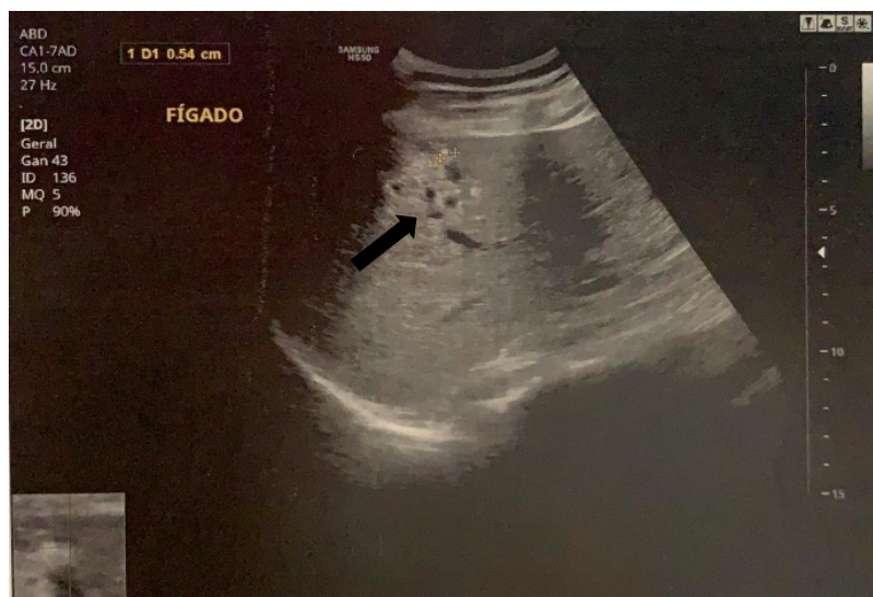
Figura 2 - Segunda USNG – focos hiperecôgenitos esparsos, medindo até 0,7cm.