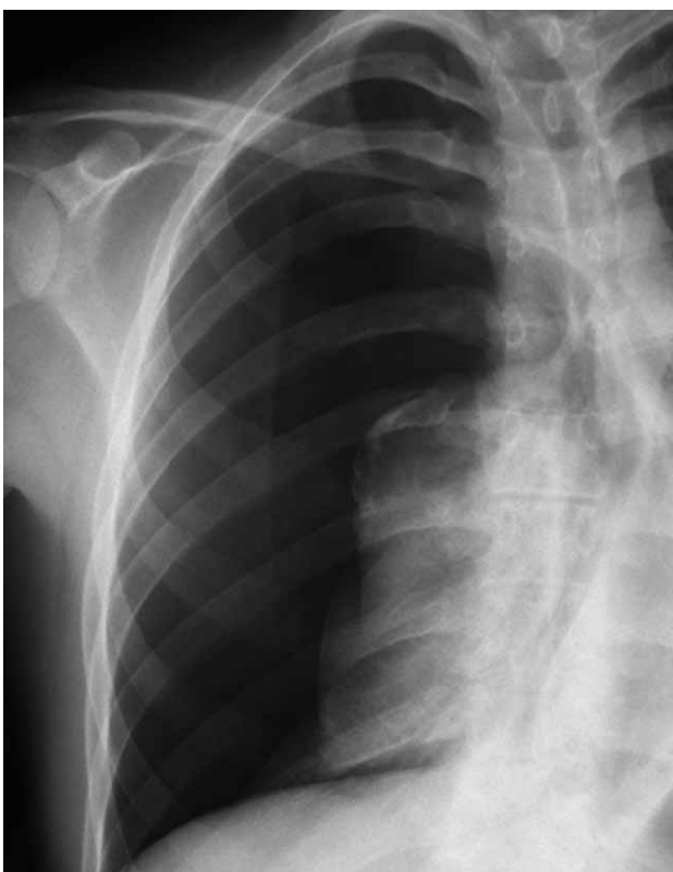
Рис. 3. Полный правосторонний пневмоторакс с полным коллапсом легкого

В самом деле, достаточно трудно определить размер пневмоторакса в сантиметрах, учитывая увеличивающееся распространение цифровых методов диагностики, или в процентах, поскольку степень сжатия легкого непостоянна и не всегда одинакова. Вследствие этого авторы данных рекомендаций предлагают классифицировать пневмоторакс на основании простых анатомических и морфологических критериев: а) частичный пневмоторакс — если висцеральная плевра отстоит от грудной стенки только в части плевральной полости, чаще апикальной (рис. 1); б) полный пневмоторакс — если висцеральная и париетальная плевра полностью отделены от грудной стенки от верхушки до основания легкого без его тотального коллапса (рис. 2); в) полный пневмоторакс с тотальным коллапсом легкого — если такой коллапс имеет место с формированием культи легкого (рис. 3). Этот метод количественной оценки пневмоторакса по рентгенограмме легкого