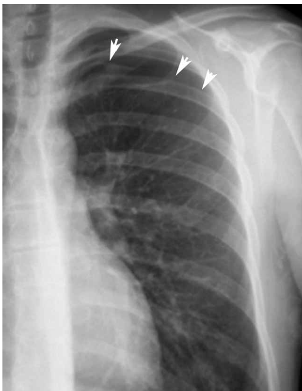
Рис. 1. Частичный пневмоторакс левого легкого

моторакса и ни в одной из 2 последних международных клинических рекомендаций выбор лечения не определяется долей коллабированного легкого [2, 28]. Консенсус АССР определяет пневмоторакс как не-