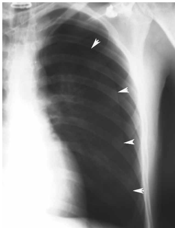
Рис. 2. Полный пневмоторакс левого легкого

моторакса и ни в одной из 2 последних международных клинических рекомендаций выбор лечения не определяется долей коллабированного легкого [2, 28]. Консенсус АССР определяет пневмоторакс как не-