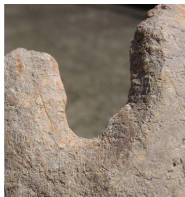
2. ábra: Csengele 53. lh., 12/16, 52 obj., 60 év feletti férfi sebészi trepanációja (fotó: Bereczki Zsolt).

Fig. 1: Zákányszék-Zákánydűlő NY/69., Grave no. 1, 40–50 years old female, surgical trepanation (photo: Zsolt Bereczki).