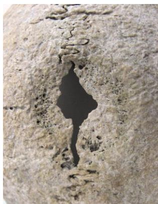
1. ábra: Zákányszék-Zákánydűlő NY/69., 1. sír, 40–50 éves nő sebészi trepanációja.

2004-ben Balogh Csilla és Türk Attila végeztek leletmentő feltárást a lelőhelyen. Az 52. objektumból egy senium korú férfi csontváza került elő. A koponya erősen hiányos, a homlokcsontjának hátsó részén, a bal margo supraorbitalétól 68 mm-re egy elnyújtott trepanációs nyílás részlete található. A seb mérete 46×27 mm (2. ábra; Bereczki és mtsai 2007). A nyílás laterális része vélhetően post mortem károsodott, de körben mindenhol jól látható rézsútosan ellaposodó peremek veszik körbe (legnagyobb szélesség 17 mm), amelyek a nyílás közepe felé lejtnek. A maradványok az SZTE Embertani Tanszékének gyűjteményében találhatóak.