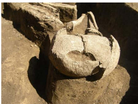
4. ábra: Makó-Járandó, a 20–39 éves nő koponyája a sírban (fotó: Várkapitányság Zrt. jogelődje).

Fig. 3: Makó-Járandó, M43. 37. lh., M43. 40. lh., OBNR 215, SNR 831, the grave of a 20–39 years old female during the excavation (photo: predecessor-in-title of Várkapitányság Zrt.).