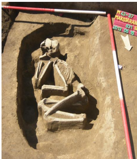
3. ábra: Makó-Járandó, M43. 37. lh., M43. 40. lh., OBNR 215, SNR 831, 20–39 éves nő sírja a feltárás során.

2013-ban az M43-as autópálya építését megelőző leletmentő ásatások során került elő a legújabb szarmata sebészi trepanáció. A Sóskuti Kornél vezette feltárás 215-ös objektumában, egy körárkos sír árkában szarmata kori, zsugorított helyzetű, 20–39 éves nő kissé töredékes váza feküdt (3. ábra). A koponya bal oldalán 55×55 mm-es nyílás látható, melynek szélei lekerekítettek, feltehetően gyógyultak (4. ábra). A nyílás a bregma ponttól 15 mm távolságban kezdődik. Az elváltozás belső átmérője a befelé szűkülő ferde vágási profilnak köszönhetően 35 mm (5. ábra).