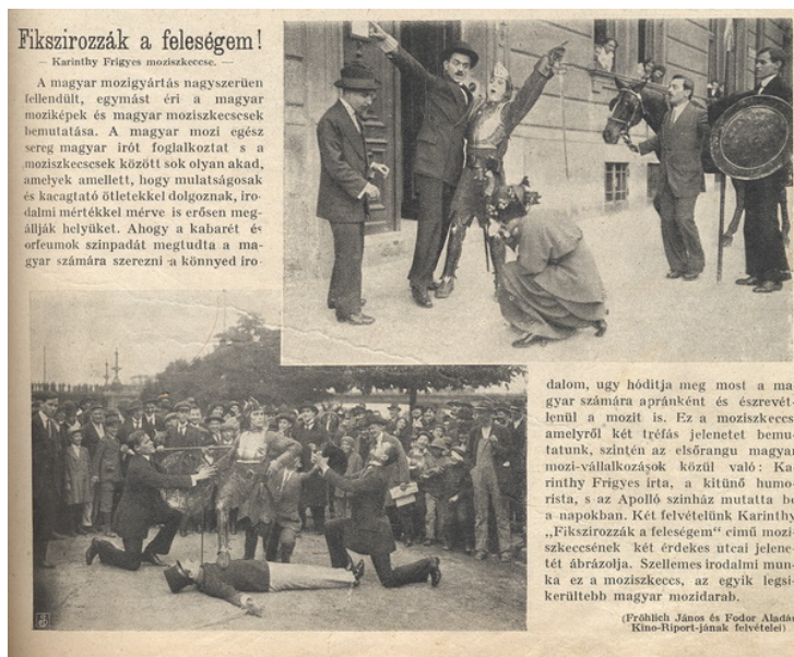
Az Érdekes Újság (1914. június 14.) beszámolója a filmről.

Az utolsó színpadi rész ( Vége, nyugodt lehet! ) által hozott végkifejlet végérvényesen szétkapcsolja a férj és a többi szereplő valóságérzékelését.