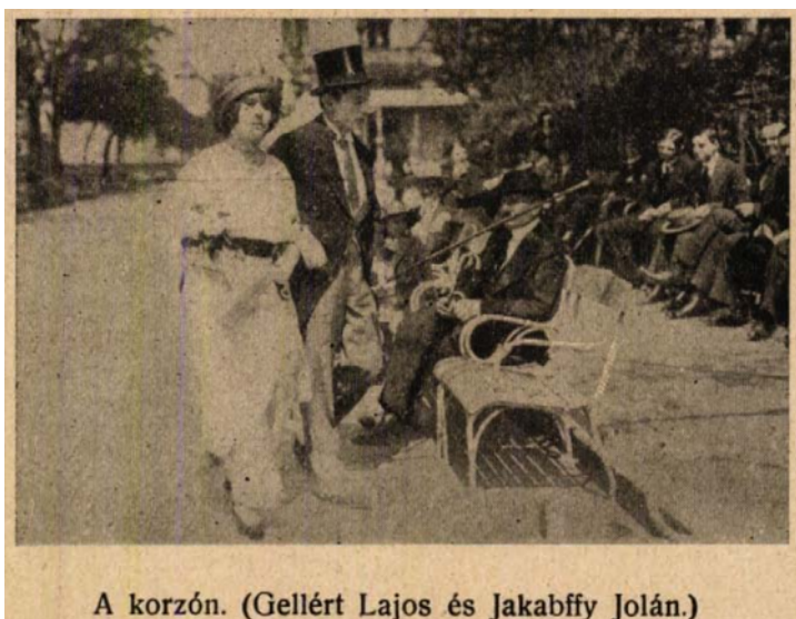
Színházi Élet, 1914. május 31.

Az első, filmes rész azzal kezdődik, hogy Karinthy, a szerző utasításokat ad a szereplőknek: egy ilyen filmkocka Molnárról is fennmaradt, talán ez az önreflexív alakzat is olyan műfaji konvenció, mint a mozik szerepeltetése a szkeccsekben. A dunaparti korzón végigvonulva, a férj és a feleség a Hangli kerthelyiségében uzsonnázik, a férj mindenkit inzultál, aki közeledik a feleségéhez.