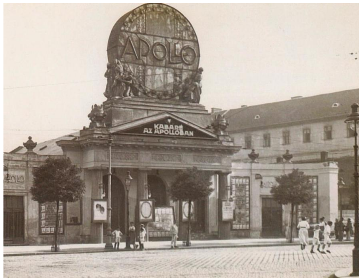
Az Apolló Mozi (1906-1923), melyet 1912-ben szkeccsek előadására alkalmas varietévé alakítanak.