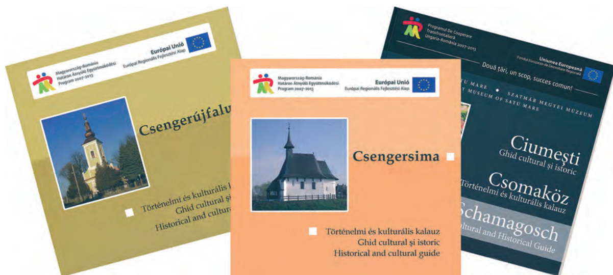
1. ábra. Válogatás a Magyarország–Románia Határon Átnyúló Együttműködési Program keretében megjelent településmonográfia sorozatból.