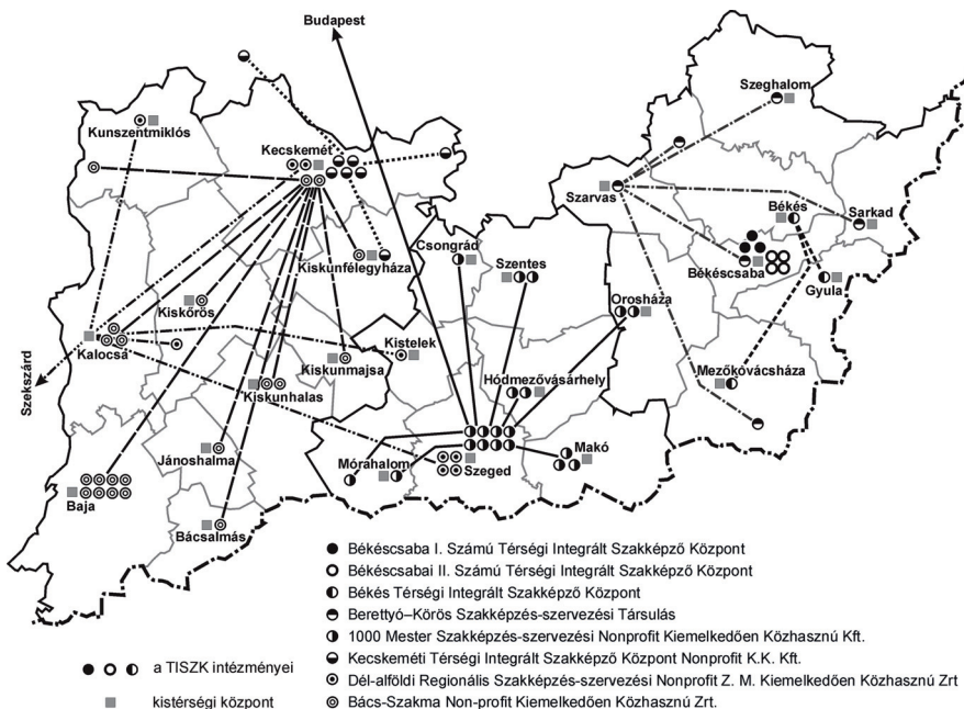
3. ábra: A térségi integrált szakképző központok szerkezete Dél-Alföldön, 2011

A jogszabályok által felkínált szabadság tehát egyszerre eredményezte a szervezeti formák anarchiáját és – az új szervezeti formák álcája mögött – a