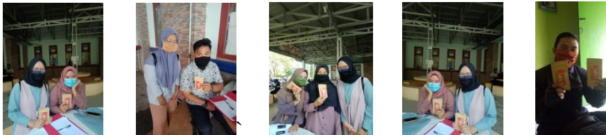
Gambar 4. Pembagian Jamu Tahap 2

Pembagian tahap 2 dilaksanakan pada tanggal 1 Juli 2020, metode yang digunakan yaitu memberikan kepada mahasiswa yang ada di sekitar kampus. Sebanyak 120 pouch jamu dibagikan pada tahap 2 ini dengan sasaran mahasiswa dari berbagai fakultas dan prodi yang ada di Universitas Bengkulu. Untuk menghindari kerumunan dan menerapkan social distancing maka tim pengabdian melakukan pembagian dengan menemui satu per satu mahasiswa yang ada di beberapa fakultas, baik yang sedang mengurus perkuliahan, tugas akhir, maupun yang sedang mengurus untuk wisuda.