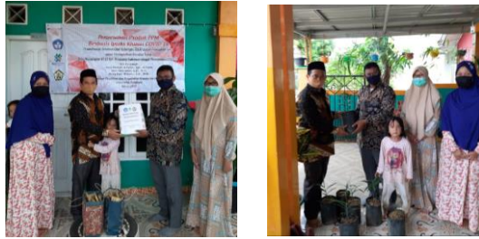
Gambar 5. Pemberian Jamu dan Bibit TOGA kepada Ketua RT.22

terhadap kegiatan pengabdian ini serta sangat mengapresiasi kegiatan ini.