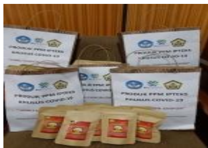
Gambar 2. Produk Jamu

Kegiatan selanjutnya yaitu adalah pembagian jamu sebagai produk kepada mahasiswa dan masyarakat RT.22 Kelurahan Pematang Gubernur. Sebelum melakukan pembagian jamu ini kepada mahasiswa, tim pengabdian terlebih dahulu mencari informasi jumlah mahasiswa yang terdampak. Pembagian jamu kepada mahasiswa dibagi menjadi 2 tahap. Tahap pertama dilaksanakan pada tanggal 1 Juni 2020 bertempat di Fakultas Matematika dan Ilmu Pengetahuan Alam (MIPA) Universitas Bengkulu. Kegiatan selanjutnya yaitu adalah pembagian jamu sebagai produk kepada mahasiswa dan masyarakat RT.22 Kelurahan Pematang Gubernur. Sebelum melakukan pembagian jamu ini kepada mahasiswa, tim pengabdian terlebih dahulu mencari informasi jumlah mahasiswa yang terdampak. Pembagian jamu kepada mahasiswa dibagi menjadi 2 tahap. Tahap pertama dilaksanakan pada tanggal 1 Juni 2020 bertempat di Fakultas Matematika dan Ilmu Pengetahuan Alam (MIPA) Universitas Bengkulu.