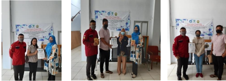
Gambar 3. Pembagian Jamu Tahap 1

buah), dan S-1 Geofisika (10 buah) dengan total 250 pouch jamu. Masing-masing perwakilan dari himpunan mahasiswa prodi telah lebih dulu mendata jumlah mahasiswa yang akan mendapatkan jamu ini.