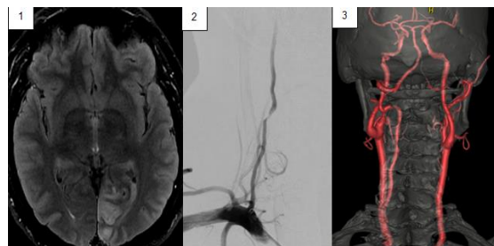
Paciente masculino de 42 años de edad. (1) RMN de cerebro: Lesión hiperintensa en Flair cortico-subcortical occipital izquierda. (2) Arteriografía por sustracción digital: estenosis severa del segmento V2 de la AV derecha, hipoplásica, secundaria a disección. (3) AngioTC: ausencia del flujo de la AV derecha en su tercio inferior y flujo filiforme distal.

anterógrada favorable. Se indica doble antiagregación (AAS 100 mg + clopidogrel 75 mg) + rosuvastatina 40 mg, se agrega quetiapina por alucinaciones visuales y topiramato por cefalea diaria. Evoluciona favorablemente en controles posteriores.