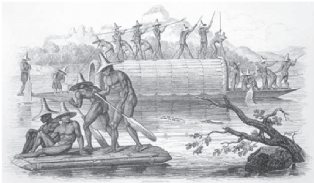
Alcide Dessalines d'Orbigny, Navigation sur la Magdalena, Biblioteca Luis Ángel Arango, Sala de Libros Raros y Manuscritos, Identificador 468, 11 x 18.3 cm