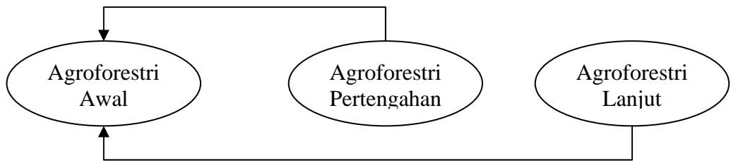
Gambar 3. Strategi Lintasan agroforestri berdasarkan skenario peningkatan penangkapan dan pemanfaatan sumberdaya