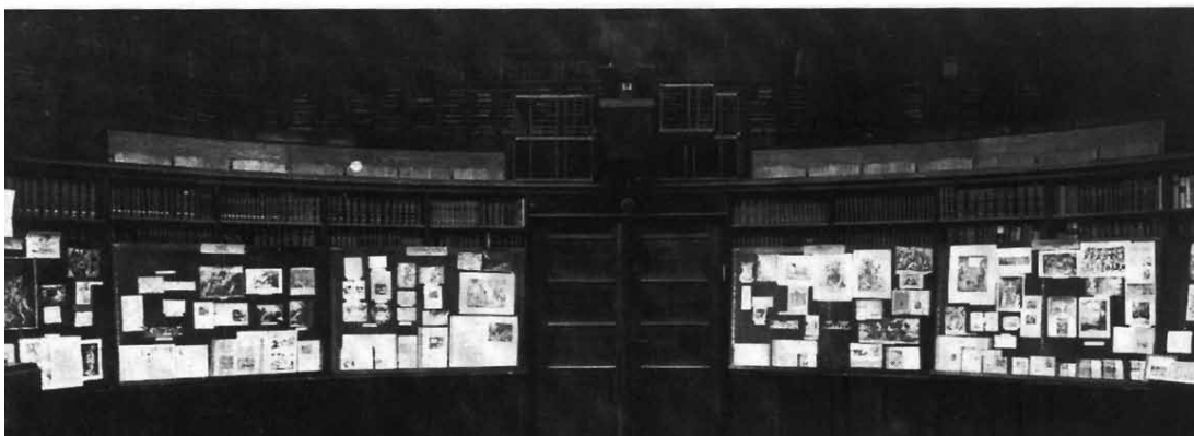
Instalações provisórias de Mnemosyne, na sala de leitura da Biblioteca Warburg provavelmente em 1925. Reproduções tiradas do livro de Michaud (1998: p. 240).