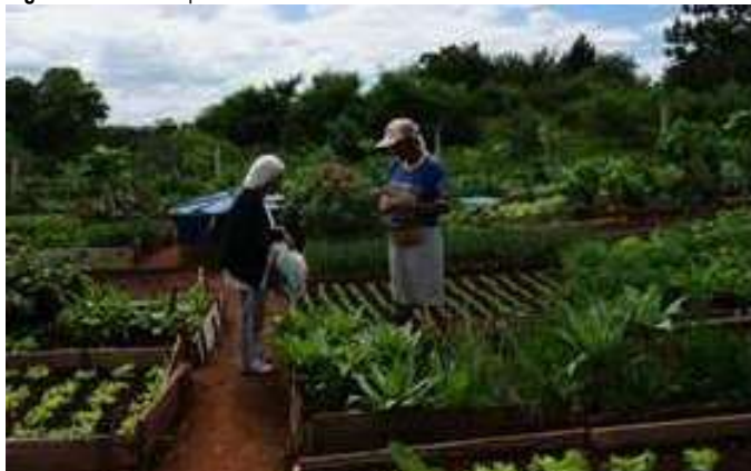
Figura 6 - Venda de produtos da Horta Comunitária – Conchal – SP - 2014.