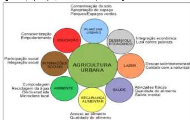
Figura 1 – (Reprodução) Elementos participantes da agricultura urbana