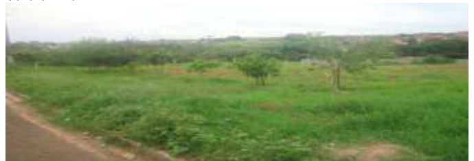
Figura 3 - Terreno como era antes, em que foi implantada a horta comunitária de Conchal – 2011.