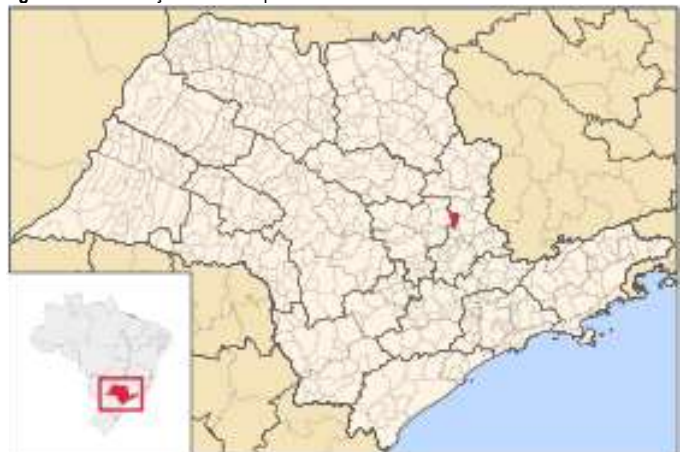
Figura 2 – Localização do Município de Conchal-SP