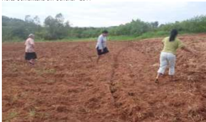
Figura 4 - Segundo mutirão de limpeza e tratamento do terreno para a implantação da Horta Comunitária em Conchal – 2011