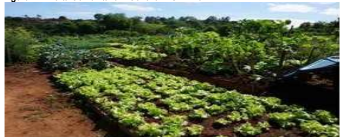
Figura 7 - Horta Comunitária – Conchal – SP – 2014.