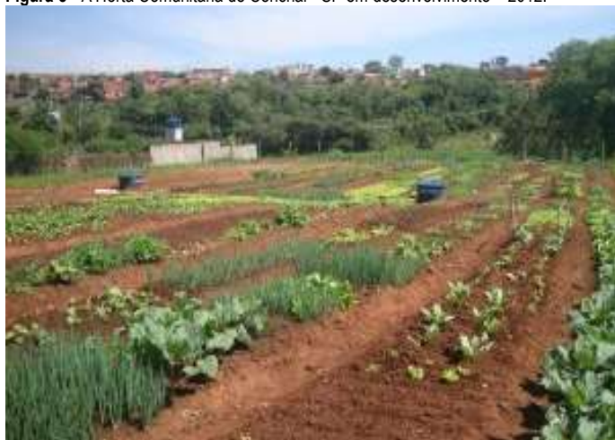
Figura 5 - A Horta Comunitária de Conchal - SP em desenvolvimento – 2012.

Outra identificação realizada pelo projeto piloto foi, por meio do relatado dos cuidadores da horta, em relação ao acesso à alimentação saudável e a possibilidade de gerar renda com a venda dos produtos que produzem (Figuras 5 e 6), o que remete novamente aos documentos norteadores deste artigo da função social da terra.