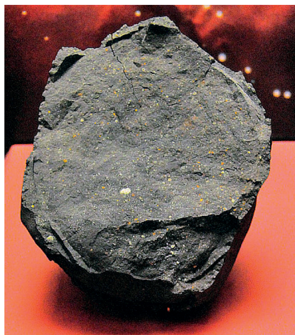
Ryc. 1. Meteoryt Murchinson.

4 mld lat temu bardzo mocno popękały na skutek intensywnego bombardowania powierzchni planety przez meteoryty. Za spr-