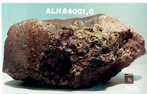
Ryc. 2. Meteoryt ALH 84001, źródło zdjęcia: pl.wikipedia.org.

wą tych niszczycielskich procesów woda dostała się w powstałe szczeliny i pozwalała na depozycję minerałów węglanowych oraz rozwój bakterii. Około 16 mln lat temu uderzenie dużego ciała kosmicznego spowodowało wyrzut materiału skalnego z powierzchni Marsa w przestrzeń kosmiczną. Scenariusz ten jest wspólny dla wszystkich skał kosmicznych z potencjalnymi śladami życia. Ostatnim etapem był spadek ALH 84001 na teren Antarktydy 13 tys. lat temu. Pod skaningowym mikroskopem elektronowym uwidoczniło się struktury na jego powierzchni (Ryc. 3) przypominające węglanowe skamieniałości organizmów bakterio-podobnych. Ich wielkości mieszczą się w przedziale 20–100 nm, w związku z tym są one parokrotnie mniejsze niż ziemskie bakterie. W październiku 2011 r. ogłoszono, że za pomocą analiz izotopowych udało się zrekonstruować pierwotne środowisko depozycji węglanów obecnych na meteorycie (HALEVY i współaut.