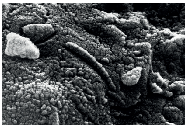
Ryc. 3. Obraz z mikroskopu elektronowego fragmentu ALH84001 struktur będących hipotetycznymi skamieniałościami form życia, źródło zdjęcia: pl.wikipedia.org.

wą tych niszczycielskich procesów woda dostała się w powstałe szczeliny i pozwalała na depozycję minerałów węglanowych oraz rozwój bakterii. Około 16 mln lat temu uderzenie dużego ciała kosmicznego spowodowało wyrzut materiału skalnego z powierzchni Marsa w przestrzeń kosmiczną. Scenariusz ten jest wspólny dla wszystkich skał kosmicznych z potencjalnymi śladami życia. Ostatnim etapem był spadek ALH 84001 na teren Antarktydy 13 tys. lat temu. Pod skaningowym mikroskopem elektronowym uwidoczniło się struktury na jego powierzchni (Ryc. 3) przypominające węglanowe skamieniałości organizmów bakterio-podobnych. Ich wielkości mieszczą się w przedziale 20–100 nm, w związku z tym są one parokrotnie mniejsze niż ziemskie bakterie. W październiku 2011 r. ogłoszono, że za pomocą analiz izotopowych udało się zrekonstruować pierwotne środowisko depozycji węglanów obecnych na meteorycie (HALEVY i współaut.