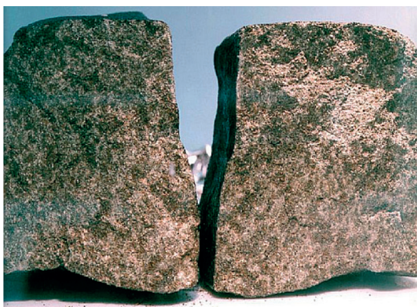
Ryc. 4. Meteoryt Nakhla, źródło zdjęcia: pl.wikipedia.org.

one być może zmineralizowanymi szczątkami marsjańskich bakterii. Należy zaznaczyć, że każdy marsjański meteoryt jest niezwykle cenny ze względu na informacje jakich dostarcza na temat samej planety. Sztandarym przykładem jest meteoryt EETA 79001, w którym pęcherzyki gazu przyniosły na Ziemię cząstkę atmosfery czerwonej planety.