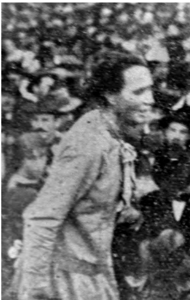
Virginia Boltén en su discurso del 1º de Mayo de 1912 en Montevideo, Uruguay.

Odiamos los gobiernos, porque nos oprimen y nos atan de pies y manos con sus leyes, entregándonos a la burguesía como si fuéramos carneros; y reservándonos el derecho de fusilarnos como a fieras si protestamos.