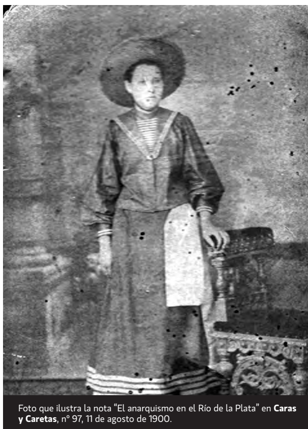
Foto que ilustra la nota “El anarquismo en el Río de la Plata” en Caretas , n° 97, 11 de agosto de 1900.

Los libertarios dejan en libertad a sus mujeres, porque saben que la mujer libre es la base de la sociedad justa; saben además, que si la mujer no es libre e instruida, no habrá paz en el hogar, pues sus ideas se volverían armas contra de ellos mismos; dejan en libertad a sus mujeres porque son libertarios, porque combaten por la libertad universal, que para conseguirla es necesario empe-