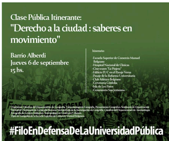
Imagen 7. Flyer difusión de clase pública, 2018

Como actividad 5 en articulación con la Secretaría de Extensión de la Facultad de Filosofía y Humanidades (UNC), en el marco de los paros docentes realizados en el segundo cuatrimestre del 2018 se logró organizar una experiencia colectiva entre cátedras de los departamentos de Geografía y Antropología (FFyH) y la Escuela