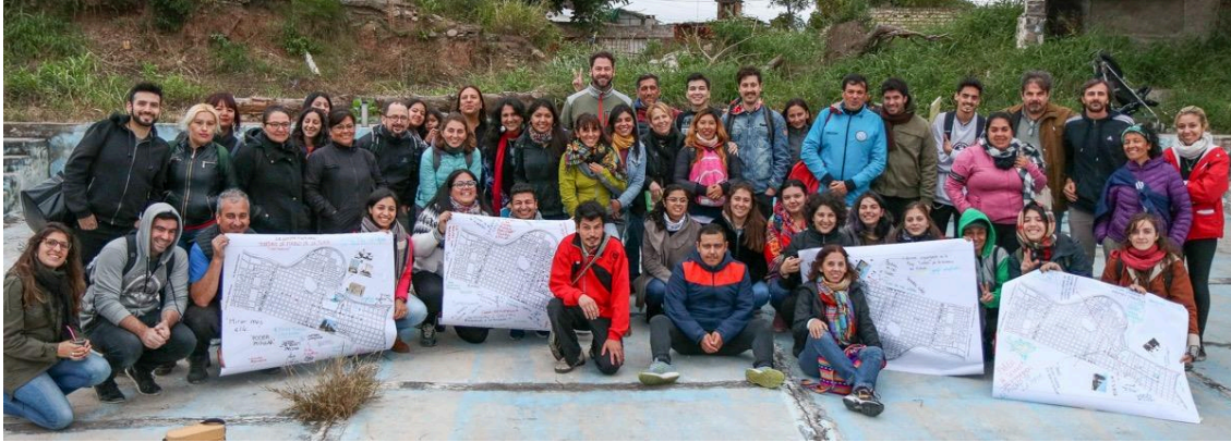
Imagen 10. Cierre de la actividad del mapeo fotográfico Alberdi 2019