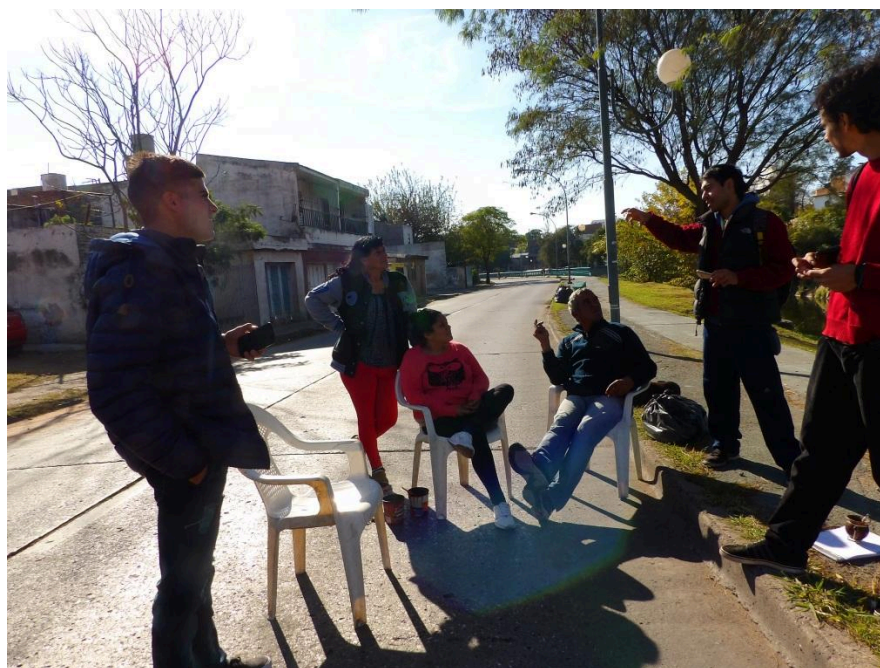
Imagen 5. Recorrido por la costanera del río Suquía, 4 de junio de 2017

El hacer extensión está vinculado a la construcción colectiva y colaborativa de conocimiento, participación activa y compromiso con la lucha de la multisectorial. Los espacios que proponemos son de diálogo de saberes, de una escucha atenta y una apertura a la diversidad de conocimientos que se entretujan en cada actividad.