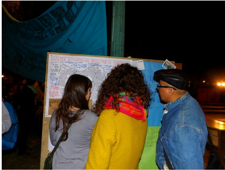
Imagen 3. Mapeo colectivo en “Dicha que tuve en Alberdi”, 28 de mayo de 2016