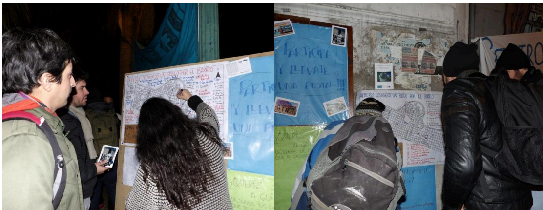
Imagen 4. Mapeo colectivo en Agitazo, 11 de junio de 2016

Cada circuito fue realizado de forma colectiva a partir de diversas actividades, talleres de discusión y mapeos colectivos en los que participaron activamente vecinx, miembros de organizaciones e instituciones del barrio.