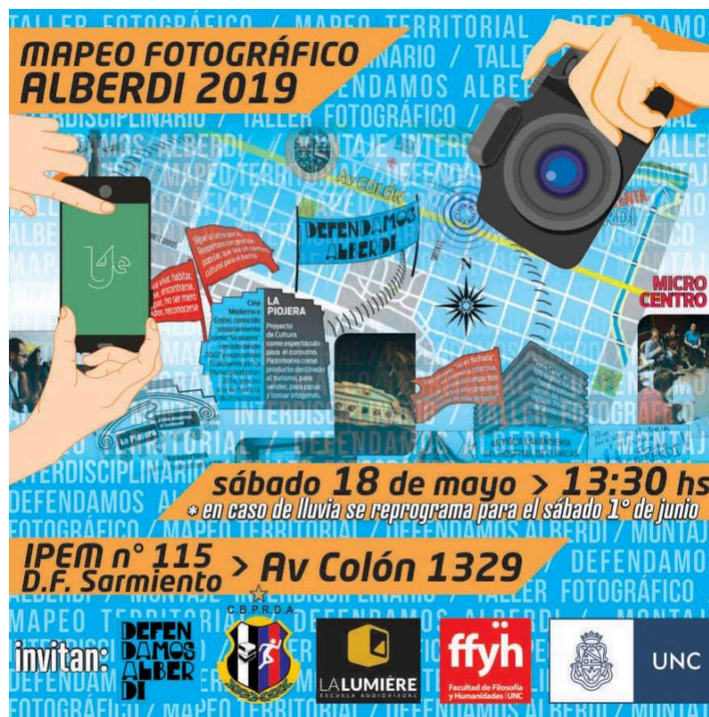
Imagen 10. Flyer invitación actividad de mapeo fotográfico Alberdi 2019