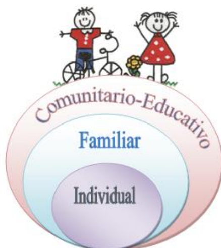
Figura 1. Ámbitos de interacción de los niños y niñas

Hay tres escenarios que son indispensables para el análisis de los efectos psicosociales del desplazamiento en la infancia colombiana, ya que son los ámbitos de interacción del sujeto que se está construyendo, que se está proyectando. Estos ámbitos en constante interacción son: el individual (El ser), el familiar y el comunitario-educativo. Ver Figura 1.