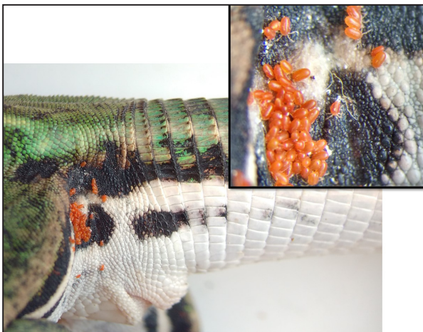
Figura 3. Región posterior de pata trasera del saurio Teyus teyou con ácaros Trombiculidae (color naranja).

Los Trombiculidae representan una de las familias de ectoparásitos más extensamente distribuidas en la región Neotropical, ocupando gran variedad de ambientes y condiciones climáticas como por ejemplo vegetación costera (Cunha Ba-