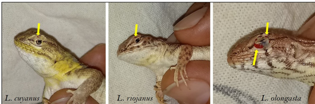
Figura 5. Ácaros Trombiculidae (flechas amarillas) en párpados superior e inferior de saurios del género Liolaemus .

En L. ramiraza e la mayor intensidad de ácaros fue en la región gular, los flancos del vientre y la cola. Esta distribución es más homogénea en las regiones corporales del hospedador como por ejemplo T. hispidus infestado con Geckobiella sp. (Delfino et al. , 2011; Bauer et al. , 1993; Bertrand y Modry, 2004) lo cual estaría relacionado con las características morfológicas adaptativas y el ciclo de vida del ácaro Neopterygosoma sp., comparado con los trombicúlidos de L. scapularis , L. cuyanus , L. riojanus , L. olongasta y T. teyou . Los ácaros Neopterygosoma , son llamados “ácaros de las escamas”, por ubicarse bajo las escamas de su hospedador, en especial en la región ventral (Fajfer, 2012, 2019; Bertrand et al. , 2013). Al igual que en L. pacha , especie sintópica de L. ramireza e (Juárez Heredia et al. , 2014; Juárez Heredia et al. , 2020), los ácaros de L. ramiraza e se encontraron solo en la región ventral