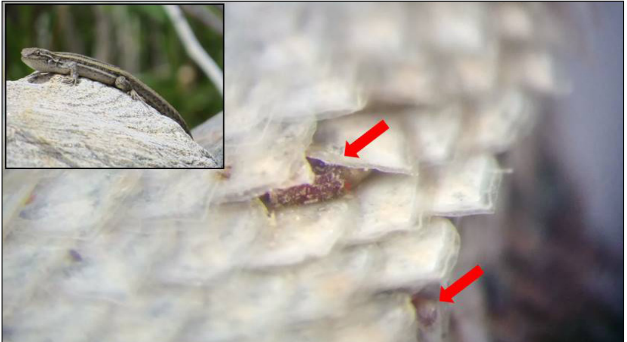
Figura 2. Ácaros del género Neopterygosoma (flechas rojas) fijos debajo de las escamas de la región gular del saurio Liolaemus ramirezae .

la Tabla 1. En cuanto a la distribución de los ácaros en T. teyou , estos se concentraron en el pliegue posterior de las patas traseras (n= 128), sobre pequeños pliegues de piel blanda y escamas granulares (Fig. 3). En L. scapularis , L. cuyanus , L. olongasta y L. riojanus los ácaros se encontraron en los párpados superiores e inferiores, con iguales características que los pliegues de T. teyou (Figs. 4, 5).