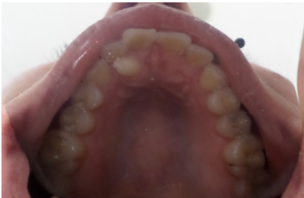
Fig. 1 Inspección Clínica

Paciente de 21 años , sin antecedentes de interés, acude al Servicio de Practicas Odontológicas Integradas de la Facultad de Odontología para una revisión odontológica. A la inspección clínica se observa la presencia de dientes supernumerarios en el arco superior por detrás de sus incisivos centrales permanentes, localizados en la línea media, con malposición. Se procede a la toma de radiografías periapical y oclusal para obtener un diagnóstico radiográfico en las cuales se observó la presencia de un mesiodens. El diagnóstico es concluyente . El tratamiento consiste en la extracción quirúrgica del mismo con pronóstico favorable.