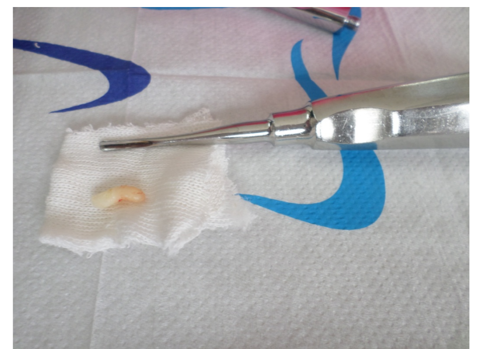
Fig. 5 mesiodens extraído.