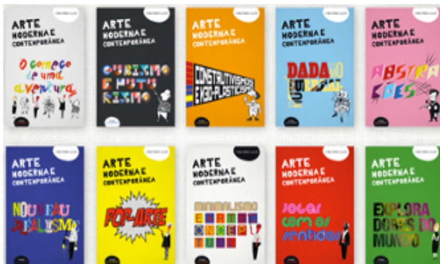
Imagen 3. Portadas de A minha primeira coleção