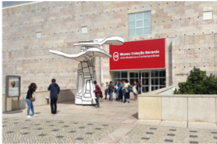
Figura 1. Exterior Museo Coleção Berardo

Rodrigues Berardo. El Museo Berardo se inauguró en 2007. La colección del Museo Berardo está formada por obras de artistas del siglo XX principalmente. La colección se puede consultar en la página web del Museo 3 .