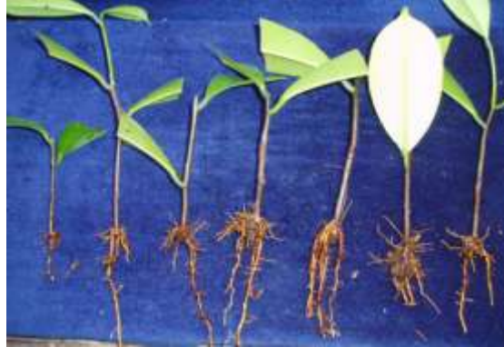
Gambar 2. Pertumbuhan stek ramin umur 3 bulan setelah tanam: Kontrol, Fusarium , Rapid root, Root Up, IBA 250 mg/l, IBA 500 mg/l, IBA 1000 mg/l (kiri ke kanan).

Namun demikian, penggunaan zat perangsang akar terbukti dapat meningkatkan pertumbuhan akar baik jumlah maupun panjang akar (Gambar 2).