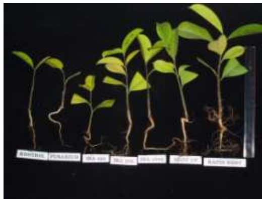
Gambar 4. Pertumbuhan stek ramin (umur 10 Bulan) setelah penyapihan Kontrol, Fusarium , Rapid root, Root Up, IBA 250 mg/l, IBA 500 mg/l, IBA 1000 mg/l (kiri ke kanan)

tumbuh yang dicoba memberikan pengaruh yang positif terhadap pertumbuhan tinggi bibit dan jumlah daun baru (Gambar 7).