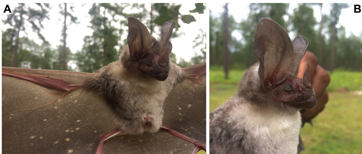
Fig. 4.— Macho adulto de L. silvicolum capturado en Mabita, Gracias a Dios, Honduras. A. Nótese el vientre y cuello blanco grisáceo que distingue a L. silvicolum de L. brasiliense y L. evotis (Williams & Genoways, 2008). B. Orejas largas y redondeadas del individuo lo que es una distintiva característica de la especie (Reid, 2009).

De L. silvicolum hay un registro no publicado sobre un macho capturado (LSUMZ 9327) en