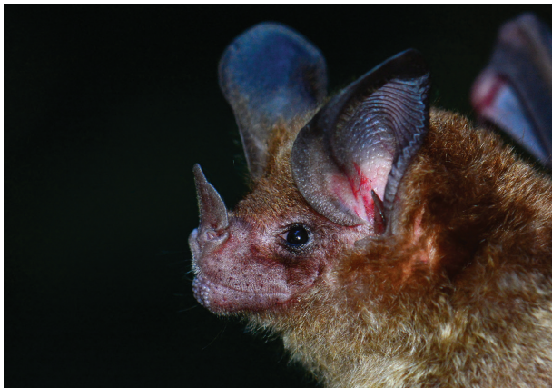
Fig. 2.— El individuo de T. bakeri capturado en Ciudad Blanca, presentó una coloración facial pardo oscuro con una línea color crema desde el inicio de las orejas hasta el final del dorso (nótese el comienzo en la foto); dorso pardo oscuro con apariencia lanoso con bandas indistintas y con la zona ventral color crema, con dos bandas de coloración: la primera banda color café con las puntas del pelo crema.

Fue capturado en un área donde predominaban palmeras (Arecaceae) a las 19:39 horas, mientras la temperatura y humedad relativa del aire estaban a 19°C y 100% respectivamente. Durante esa misma noche se capturaron individuos de las siguientes especies: M. microtis , L. brasiliense , T. bakeri , C. sowelli , C. perspicillata , G. commissarisi , D. watsoni , A. jamaicensis y A. lituratus .