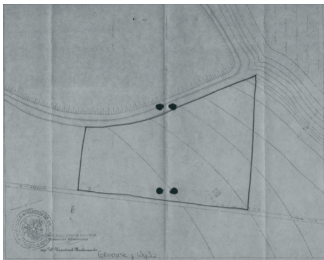
Rys. 2. Zasoby online NID - forma prezentacji informacji o zabytku archeologicznym [12]. Fig. 2. Online resources NID - a form of presentation of the archaeological monument [12].