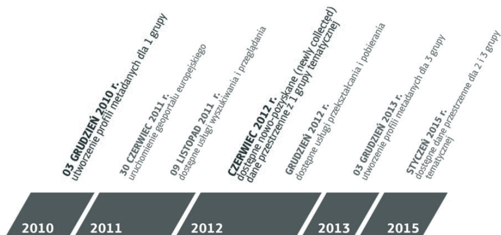
Rys. 1. „Mapa drogowa” Dyrektywy INSPIRE [11].

Ustawa o infrastrukturze informacji przestrzennej , wypełniając ustalenia Dyrektywy INSPIRE, nakłada na organy wiodące terminy organizacji i udostępnienia zbiorów danych przestrzennych oraz odpowiadających im usług. Obowiązujący harmonogram prac związany jest z terminami zdefiniowanymi w tzw. „mapie drogowej” ( Roadmap ) Dyrektywy INSPIRE (Rys.1.). Zgodnie z nim do czerwca 2012 roku powinny zostać udostępnione dane przestrzenne z pierwszej grupy tematycznej, w tym także dane dotyczące tematu „Ochrona dziedzictwa kulturowego”. W dalszej kolejności, do końca 2015 roku wszyscy uczestnicy przedsięwzięcia powinni zakończyć prace nad udostępnieniem odbiorcom danych przestrzennych w pozostałych dwóch grupach tematycznych, w tym w dane dla tematu „Zagospodarowanie przestrzenne”.