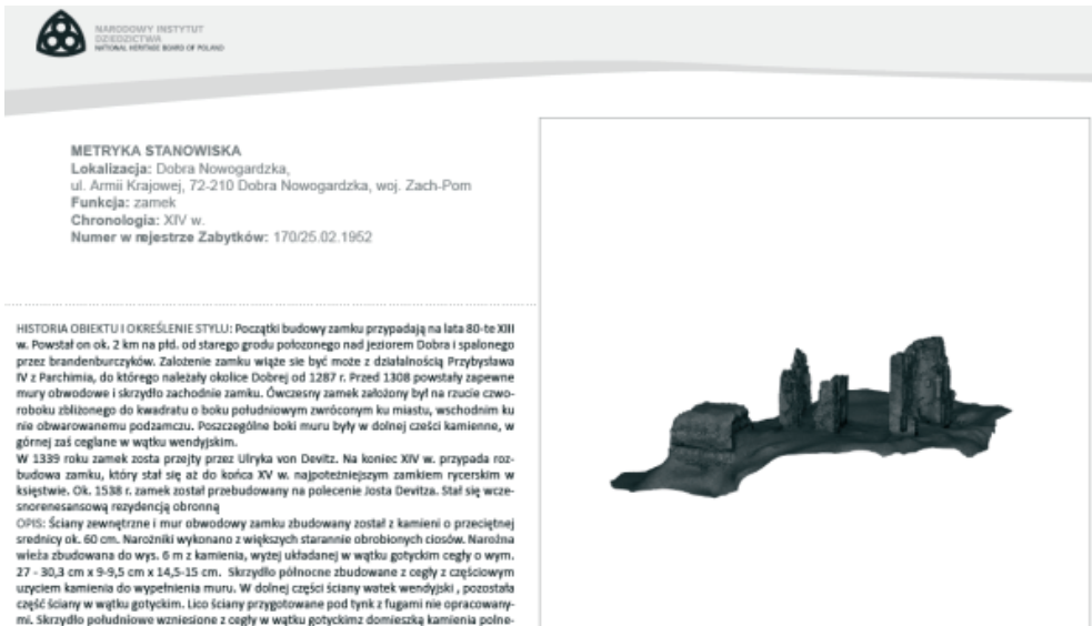
Rys. 3. Zasoby online NID - forma prezentacji informacji o zabytku nieruchomym [12].