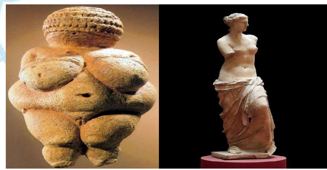
Venus of Willendorf (1); Venus de Milo (2)

Department of General Hygiene of Nicolae Testemitanu State University of Medicine and Pharmacy Chisinau, Republic of Moldova