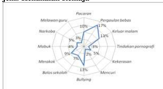
Gambar 2. Tingkatan Pengukuran Jenis-jenis Kenakalan Remaja

Dari diagram 2 diketahui bahwa urutan kenakalan remaja yang mendapat penilaian negatif dari yang paling tinggi ke yang rendah, yaitu: pergaulan bebas, bullying , keluar malam, pacaran, merokok, bolos sekolah, narkoba,