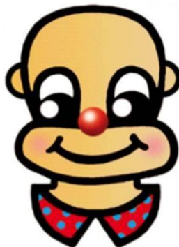
Abbildung 2. Schmunzel®, die Spielfigur, die die Kinder durch die Serious Games führt

Damit können die Kinder die Übungen selbständig, ohne Hilfestellung durch einen Erwachsenen am Computer durchführen und sind somit von der zeitlichen Verfügbarkeit des Erwachsenen unabhängig. Zusätzlich bringt dieses Setting den Vorteil, dass auch Kinder von Familien mit Migrationshintergrund, deren Eltern möglicherweise nicht über die erforderliche Sprachkompetenz in Deutsch verfügen, um zum Beispiel Durchführungsanleitungen der Übungen sinnverstehend lesen zu können oder verbale Aufgaben in akzentfreier Aussprache vorzugeben, die Behandlung in Anspruch nehmen können. Außerdem bietet die Durchführung der Serious Games aufgrund des minimalen Zeitaufwands für den Erwachsenen, der lediglich den Download der Spiele vornehmen und diese initialisieren muss, auch die Möglichkeit, Kindern, bei denen eine oder mehrere Teilleistungsschwächen als Basis der Rechtschreibschwäche diagnostiziert wurde, die aber keine häusliche Unterstützung zur Verfügung haben, im Rahmen einer Unterstützung durch Lehrer_innen die Behandlung angedeihen zu lassen.