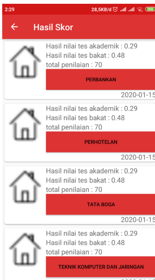
Gambar 1. Hasil Perekomendasi Jurusan

Selanjutnya sistem akan memilih 3 jurusan yang nilai total weighted evaluation nya tertinggi sesuai nilai weight evaluation yang terdapat pada tabel 5 kemudian akan ditampilkan pada aplikasi Android . Apabila terdapat nilai yang sama maka akan tetap direkomendasikan juga. Jadi, dalam satu pilihan ada kemungkinan terdapat beberapa jurusan yang direkomendasikan. untuk hasil dari rekomendasi dapat dilihat pada gambar dibawah ini.