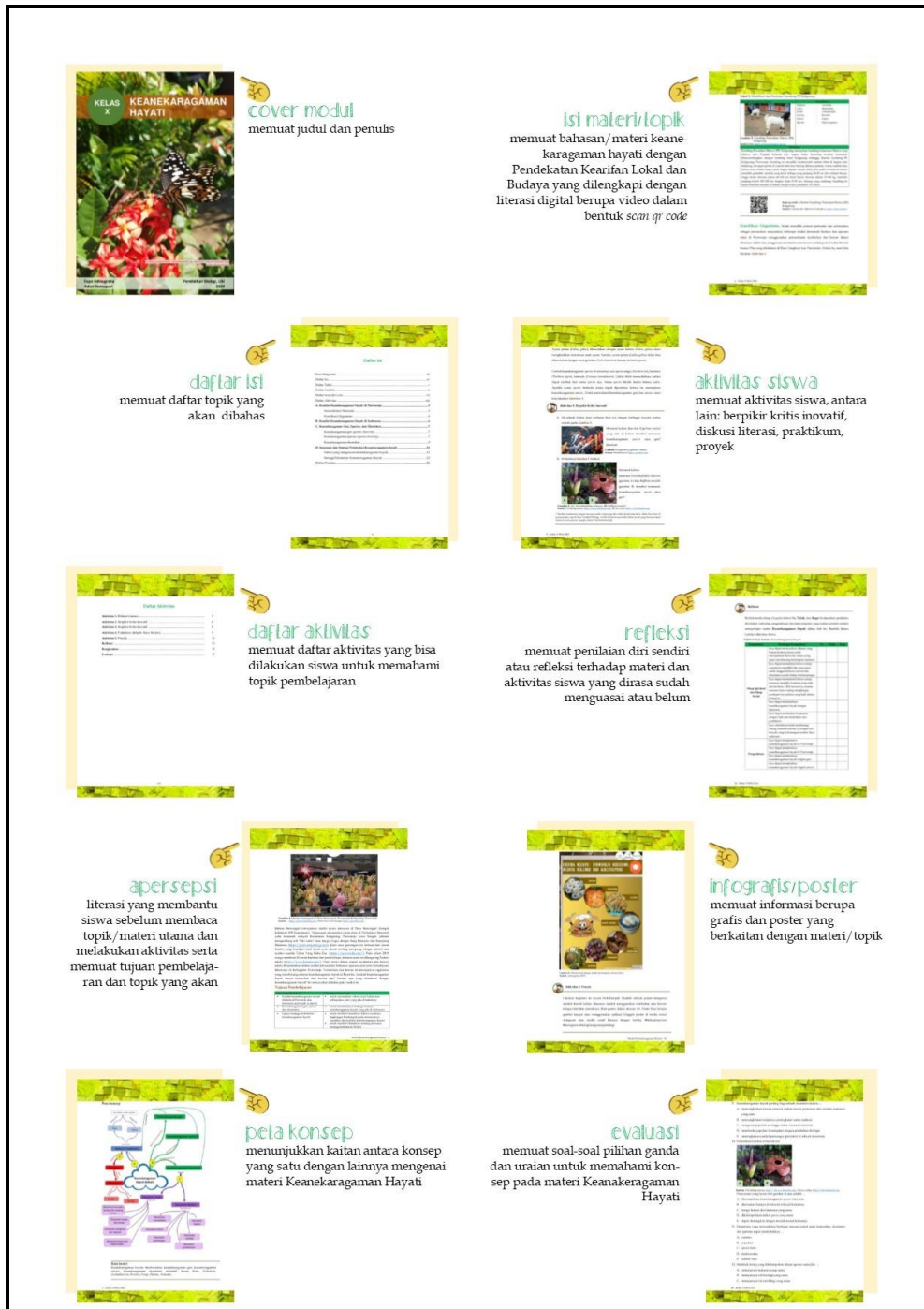
Gambar 2. Isi Modul Keaneekaragaman Hayati dengan Pendekatan Kearifan Lokal dan Budaya Sumer. Adinugraha (2020)

yang dapat mempermudah materi, orisinalitas isi dan penyajian, serta mengutamakan toleransi dan tidak diskriminatif (Adinugraha, 2020). Bagian isi modul disajikan pada Gambar 2 .