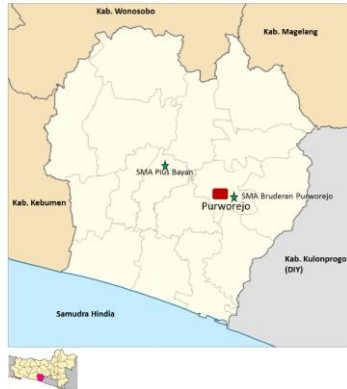
Gambar 1. Lokasi Penelitian di Kabupaten Purworejo

Sumber. Dimodifikasi dari Wic2020, https://id.m.wikipedia.org/ ; Mandamaruta, https://commons.wikimedia.org/