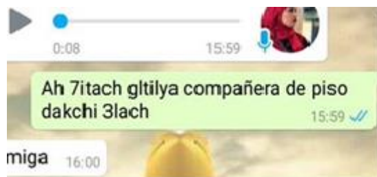
Figura 1. Ah 7itach gtiliya compañera de piso dakchi 3lach (Ah porque me comentaste que fue la compañera de piso y por eso)

En segundo lugar, observamos, cómo se desdibujan las fronteras lingüísticas en la interacción: «Ah 7itach gtiliya compañera de piso dakchi 3lach ».