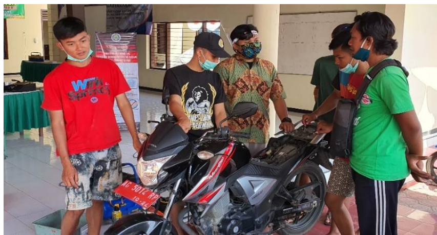
Gambar 8. Praktik Service Sepeda Motor Honda Tiger Kendaraan Dinas Kepala Desa Bangoan

Dalam kegiatan perawatan ini peralatan service disiapkan oleh Tim satgas pengabdian. Selain itu Tim Satgas juga menyiapkan penggantian olie Gratis kepada para peserta yang kendaraannya sudah waktunya ganti olie. Kegiatan praktik service ini dibimbing oleh Tim satgas dan dibantu oleh 2 orang Mahasiswa dari Jurusan Teknik Mesin FT UM.