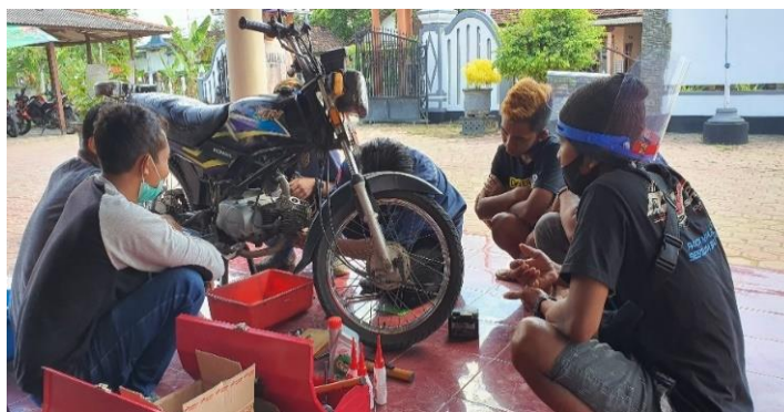
Gambar 9. Praktik Service Sepeda Motor Honda Win Milik Perangkat Desa yang diservice oleh Peserta pelatihan

Selain praktik perawatan ringan kendaraan jenis Honda Tiger dan Honda Win dengan system versneling manual, peserta juga melakukan perawatan penggantian olie dan service ringan jenis kendaraan matic milik peserta pelatihan. Pengelompokan pelatihan service dibagi menjadi kelompok sepeda motor matic dan kelompok sepeda motor konvensional (Non-matic). Gambar 11 menunjukkan gambar kelompok praktik sepeda motor matic. Sedangkan Gambar 12. menunjukkan gambar pengelompokan praktik sepeda motor manual (Non-Matic).