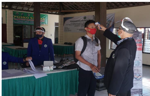
Gambar 2. Pengukuran suhu badan oleh Tim Satgas Sebelum Peserta mengikuti Pelatihan Service Sepeda Motor

Kegiatan wajib menerapkan protocol Kesehatan Covid-19. Sebelum mengikuti kegiatan pelatihan peserta wajib: cuci tangan, menggunakan masker, face shield, dan test suhu badan, dan melakukan pengisian daftar hadir peserta yang dilayani oleh Tim Satgas Pengabdian. Panitia menyiapkan masker, hand sanitizer, dan face shield yang dibagikan kepada peserta pelatihan.