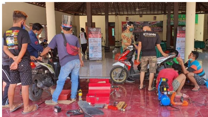
Gambar 10. Perawatan dan Ganti olie Sepeda Motor matic Honda Beat Milik Peserta Pelatihan