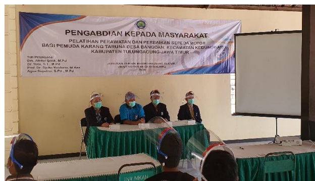
Gambar 4. Kepala Desa Di damping oleh Tim Satgas Pengabdian dalam Acara Pembukaan Pelatihan Service Sepeda Motor bagi Karang Taruna Di Balai Desa Bangoan, Kec. Kedungwaru, Kab. Tulungagung

Berdasarkan jadwal pelatihan yang sudah disajikan, maka Langkah-langkah pada pelaksanaan kegiatan pelatihan service sepeda motor disajikan secara berturut turut sebagai berikut: (1) Pengenalan Mesin Sepeda Motor 2 Tak dan 4 Tak, (2) Sistem Pelumasan, (3) Sistem Pendinginan, (4) Sistem bahan Bakar, (5) Mekanisme Kopling, (6) Mekanisme Gear, (7) Sistem kelistrikan dan (8) Praktik Perawatan (service) Sepeda Motor. Seluruh materi disajikan dalam waktu 2 hari yaitu tanggal 17 dan 18 Juli 2020.