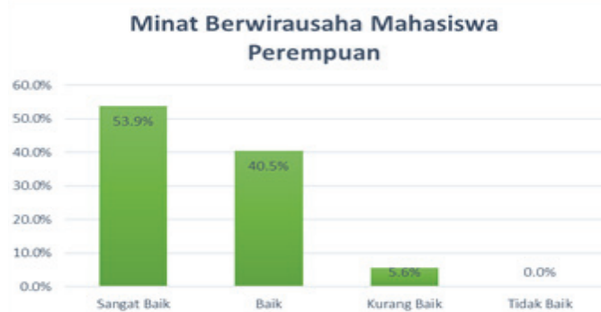
Gambar 2 Diagram Persentase Tingkat Minat Berwirausaha Mahasiswa Perempuan