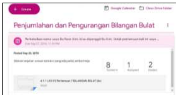
Gambar 2. Progress Pengerjaan Tugas

Proses tentang pengerjaan tugas yang telah dilakukan mahasiswa dapat dilihat oleh dosen pada dashboard dapat dilihat pada Gambar 2. Pada gambar tersebut tampak 10 dari 11 mahasiswa yang cepat dalam merespon tugas dan langsung mengumpulkannya begitu tugas diberikan. Delapan orang diantaranya yang belum dikoreksi, sementara dua orang lainnya sudah dikoreksi dan hasilnya sudah dikembalikan. Sementara sisanya satu orang tidak mengumpulkan.