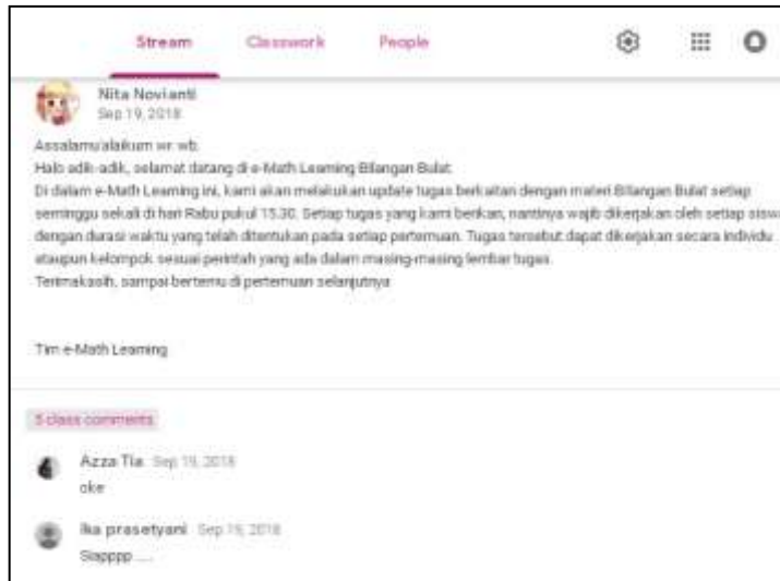
Gambar 1. Awal Pertemuan

Proses tentang pengerjaan tugas yang telah dilakukan mahasiswa dapat dilihat oleh dosen pada dashboard dapat dilihat pada Gambar 2. Pada gambar tersebut tampak 10 dari 11 mahasiswa yang cepat dalam merespon tugas dan langsung mengumpulkannya begitu tugas diberikan. Delapan orang diantaranya yang belum dikoreksi, sementara dua orang lainnya sudah dikoreksi dan hasilnya sudah dikembalikan. Sementara sisanya satu orang tidak mengumpulkan.