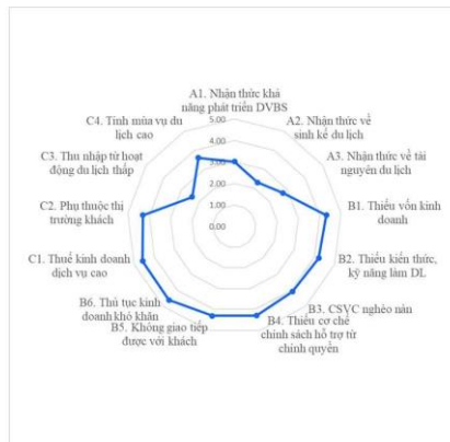
Sơ đồ 2. Đánh giá chung các yếu tố cản trở sự tham gia của người dân trong phát triển dịch vụ du lịch bổ sung tại các điểm di tích LSVH tỉnh Quảng Trị

Tổng hợp các yếu tố tác động đến sự tham gia của người dân trong phát triển các dịch vụ du lịch bổ sung ở Sơ đồ 2 cho thấy nhận thức chưa đầy đủ về hoạt động du lịch, cùng với các điều kiện khó khăn về cơ chế, nguồn lực và những hạn chế trong hoạt động kinh doanh dịch vụ du lịch bổ sung là những rào cản lớn đối với sự tham gia của người dân. Trong đó, đa số các khó khăn là các yếu tố bên ngoài như thủ tục kinh doanh, thuế cao, sự phụ thuộc thị trường khách... Đồng thời, các yếu tố nội tại gây cản trở nhiều nhất đến sự tham gia của người dân là những yếu tố liên quan đến nguồn nhân lực như nhận thức về du lịch, kỹ năng ngoại ngữ, kỹ năng giao tiếp kinh doanh. Như vậy, để cải thiện sự tham gia của người dân trong phát triển các dịch vụ du lịch bổ sung tại các điểm di tích LSVH của tỉnh Quảng Trị thì cần có những chính sách và giải pháp có hiệu lực trong bồi dưỡng, đào tạo nguồn nhân lực cũng như cải thiện thủ tục và môi trường kinh doanh.