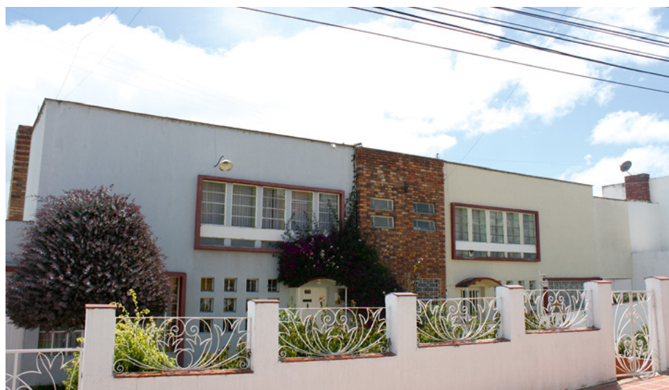
Figura 4. Casas en serie construidas por el Ingeniero Arquitecto Ernesto Muñoz Navarro.