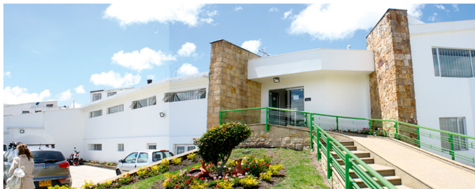
Figura 3. Casa destinada por varios años a los gerentes de Gaseosas Postobón.