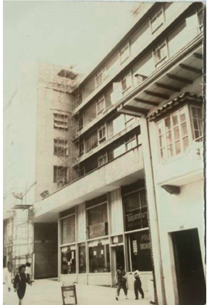
Figura 5. Banco del Comercio, 1991 (FER)