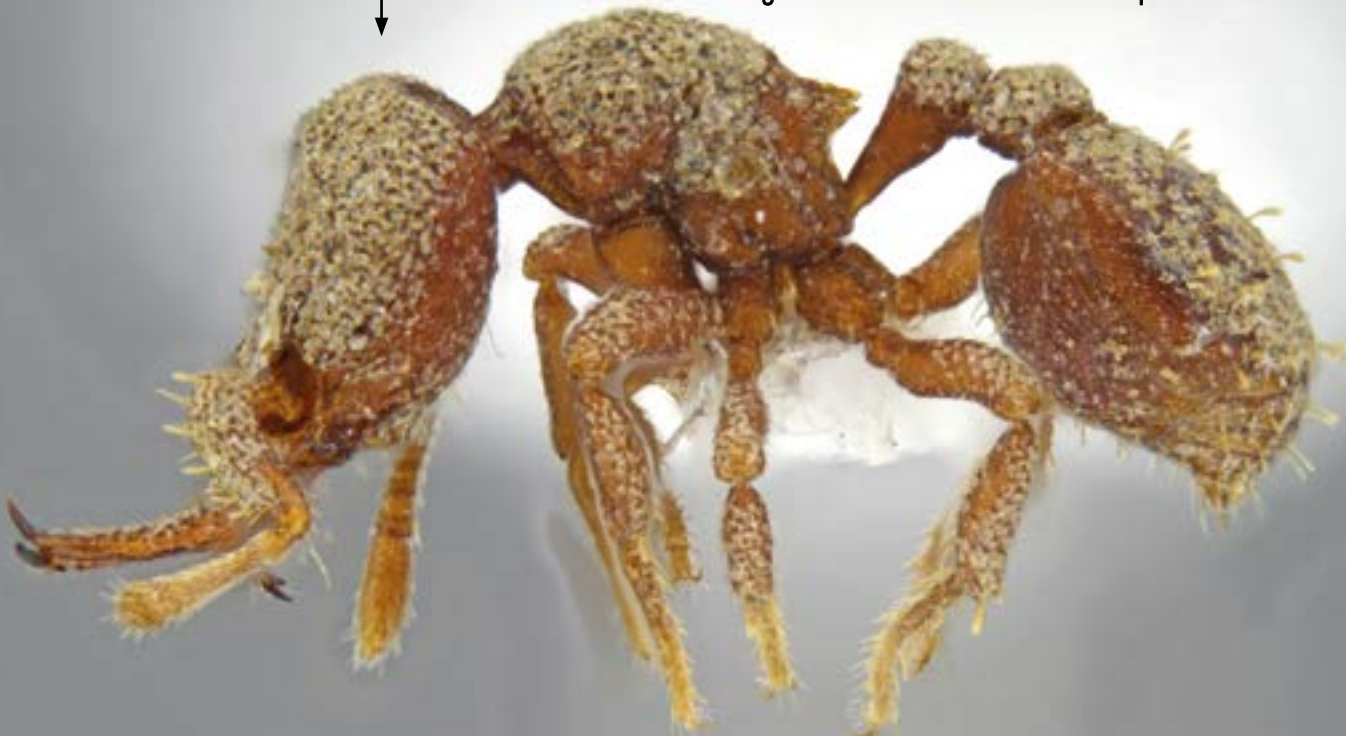
Foto 3. Cabeza y cuerpo lateral de de Protalaridris arhuaca . Hormiga endémica de la Sierra Nevada de Santa Marta. Fotografía tomada con estereomicroscopio motorizado.

En el CBUMAG se preparó una colección itinerante con ejemplares escogidos para presentar a los visitantes, la cual incluye dos gavetas entomológicas con ejemplares de diferentes órdenes: