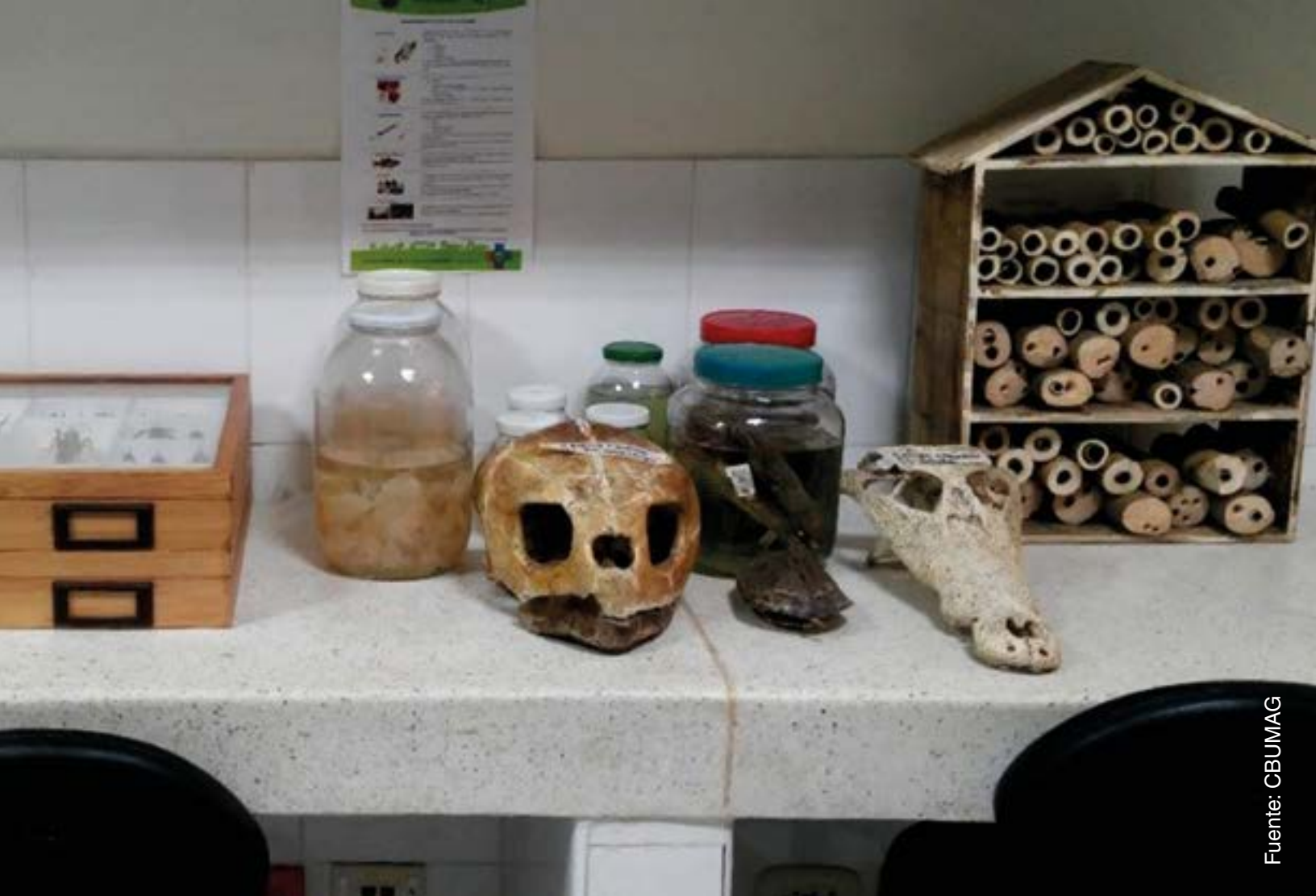
Foto 1. Colección itinerante del CBUMAG

que el filósofo griego Aristóteles hizo en el siglo IV a. C., cuando propuso un método de clasificación llamado Scala Naturae . Asimismo, una de las colecciones más antiguas fue el templo de las musas (de ahí el nombre del museo), fundado por Ptolomeo Sotor en el siglo III a. C., en cuyos restos fueron halladas exóticas conchas marinas. En tiempos más recientes, las personas han coleccionado excentricidades por prestigio. Otros, interesados en la botánica, mantienen herbarios.