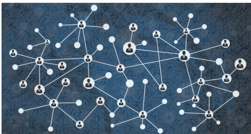
Figura 1. Formación de redes sociales

Según Castells (1999) vivimos en la sociedad de la información, y en este sentido, si llevamos a cabo la definición de redes sociales, podemos percibir que cada uno de los nodos (o actores sociales) establece una conexión con otros nodos a través de la comunicación, creando así una red de actores, una red de participación. Pero por cada red formada (figura 1), sean centrales o periféricas, hay posicionamientos relacionados con la fuerza, fluidez y proximidad de las relaciones que se establecen (Horochovski, 2008). La comunicación se muestra como una forma de ejercer poder, democracia y cooperación. Llevar a todos a la libertad como perspectiva de ampliar su empoderamiento social y aumentar la posibilidad de participación en otros ámbitos.