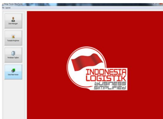
Gambar 5.13 Tampilan Halaman Utama

Menu Login sebagai gerbang sebelum masuk ke menu utama. Menu ini berfungsi untuk membatasi siapa saja yang diperbolehkan mengakses data dengan fasilitas-fasilitas yang ada