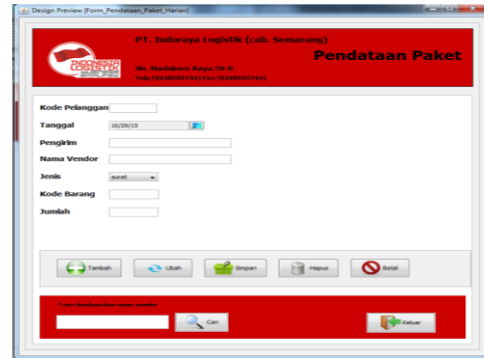
Gambar 5.17 Tampilan Form Paket Harian