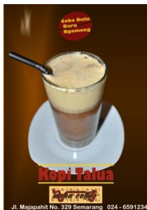
Gambar 4 Display menu

Arti dari kalimat tersebut adalah menegaskan pada masyarakat untuk datang dan membuktikan bahwa kafe Maha Coffee ini berbeda dari kafe kopi lain dari rasa dan berbagai varian menu lainnya.