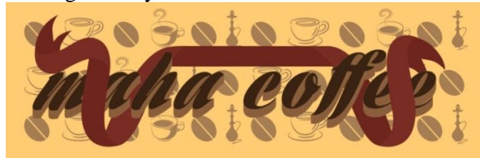
Gambar 1 Logo Photo Background

identitas dari kafe kopi. Warna merah pada pita yang melambangkan bahwa kafe Maha Coffee yang ingin merangkul banyak konsumen.