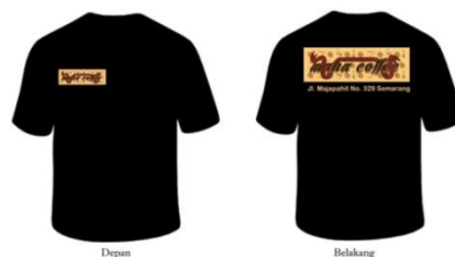
Gambar 10 T - shirt

b) Layout : Menempatkan posisi logo dengan ukuran kecil dibagian depan t-shirt diletakkan disebelah kanan atas sebagai simbol identitas mengarah kebaikan, sedangkan dibagian belakang logo serta alamat diletakkan di tengah atas dengan ukuran lebih besar supaya terlihat jelas dan balance . Dengan warna t-shirt hitam sebagai pengunci logo dan elegan dipandang mata.