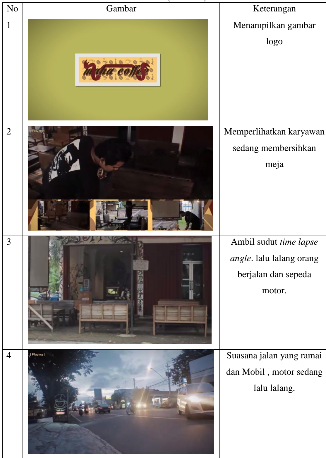
Tabel 4 (Produksi)