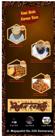
Gambar 5 X - banner

Arti dari kalimat tersebut adalah mengajak masyarakat untuk datang dan membuktikan bahwa kafe Maha Coffee ini berbeda dari kafe kopi lain dari rasa dan berbagai varian menu lainnya.