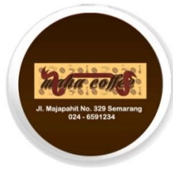
Gambar 11 Pin