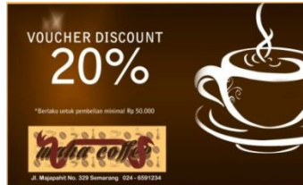
Gambar 9 Discount voucher

b) Layout : Menempatkan posisi cangkir kopi di sudut kanan sebagai point of interest . Discount voucher menampilkan sebagian cangkir kopi yang mewakili identitas kafe kopi dengan tulisan besaran diskon dan ketentuan yang berlaku dibawahnya terdapat logo. Warna coklat digunakan sebagai warna dasar dan warna putih sebagai warna font agar kontras.