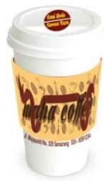
Gambar 7 Packaging cup hot