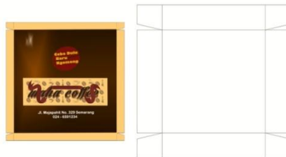
Gambar 8 Packaging makanan

Arti dari kalimat tersebut adalah menegaskan pada masyarakat untuk datang dan membuktikan bahwa kafe Maha Coffee ini berbeda dari kafe kopi lain dari rasa dan berbagai varian menu lainnya.