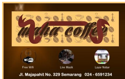
Gambar 12 Stiker

b) Layout : logo yang ditempatkan ditengah untuk sebagai point of interest dan alamat dan tiga bentuk lingkaran yaitu beberapa fasilitas agar terlihat balance , warna cokelat memberikan kesan simpel, alami dan hangat.