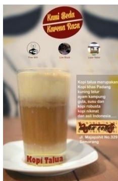
Gambar 3 Poster