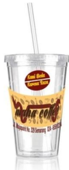
Gambar 6 Packaging cup ice