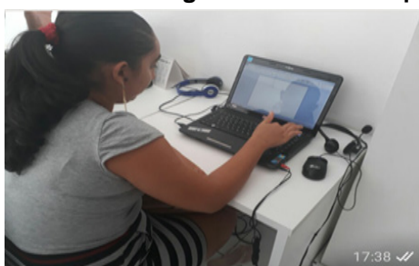
Figura 1 – Educanda digitando texto no computador

A empresa estudada conta com um laboratório de informática, onde as aulas eram ministradas, e com vinte computadores, sendo um para cada educando realizar as suas atividades, no qual os mesmos têm acesso a sua plataforma de estudos através de um login e senha disponibilizados pela empresa. Logo abaixo, nas imagens 1 e 2, observa-se que as educandas estão procurando as letras do alfabeto no teclado do computador para nomear suas atividades.