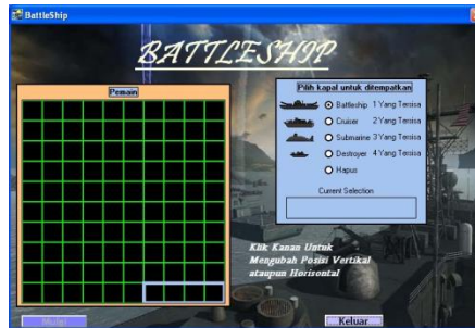
Gambar 3. Tampilan papan permainan

Berdasarkan hasil analisis dan perancangan sistem yang telah dilakukan, maka dilakukan implementasi ke dalam bentuk program komputer. Implementasi merupakan tahap menerjemahkan hasil perancangan perangkat lunak secara rinci kedalam bahasa pemrograman. Implementasi dilakukan dengan menggunakan bahasa pemrograman Microsoft Visual Basic 6.0, sehingga hanya dapat dijalankan pada komputer dengan sistem operasi Windows . Berikut tampilan papan permainan battleship terlihat pada gambar 3