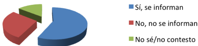
Figura 1. Información de los MENA