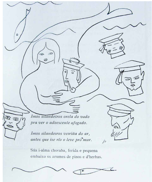
Fig. 3. Página de "Seis poemas galegos" (1935) de Federico García Lorca, con tinta original de Luis Seoane. Colección privada.