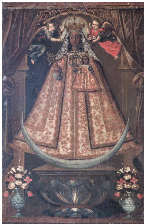
Fig. 5. Virgen de Guadalupe , obrador santafereño, s. XVIII, óleo sobre lienzo, Iglesia de la Virgen del Rosario, Villa de Leyva.

zos donde los personajes sagrados cubren sus cabezas con sombreros mulatos rematados en penachos de palmeras. Son ejemplos de ello el lienzo del Santuario de la Virgen de Bojacá 10 y el que pertenece a la colección Hernández ya nombrado. Frente a este sincretismo artístico y devocional de vocación integradora, encontramos en Tunja una práctica diametralmente opuesta, ya que, en el convento clariano, se puede ver la versión decolorada de la Virgen de Guadalupe de Extremadura. Este blanqueamiento de la imagen original seguramente responde a las mismas razones de tipo social ya apuntadas para otros casos de vírgenes negras importadas en el contexto de la América virreinal 11 .