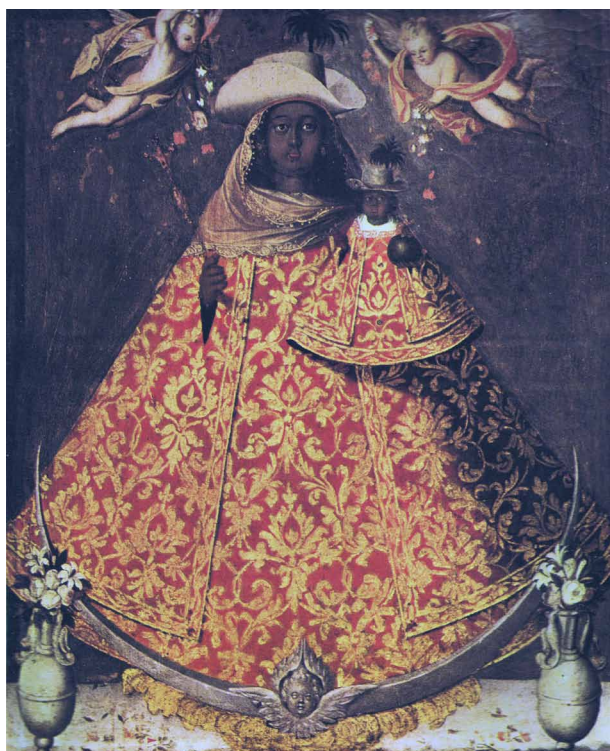
Fig. 6. Virgen de Guadalupe, obrador santafereño, s. XVIII, óleo sobre lienzo, Santuario de la Virgen de la Salud, Bojacá.