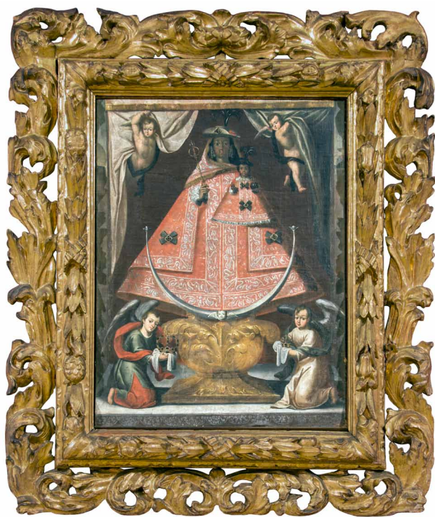
Fig. 2. Virgen de Guadalupe, obrador santafereño, s. XVII, Colección Hernández.