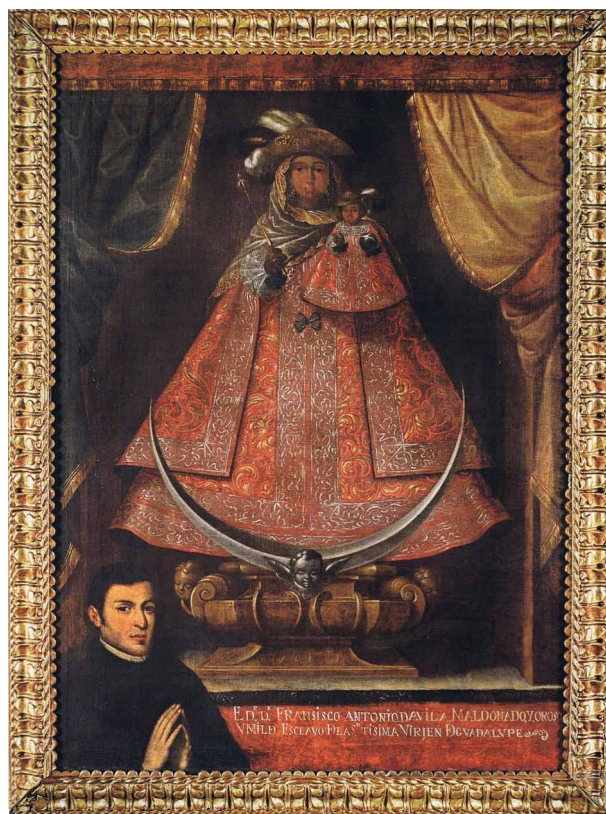
Fig. 1. Virgen de Guadalupe , Gregorio Vázquez, s. XVII, óleo sobre lienzo Colección Arquidiócesis de Bogotá.