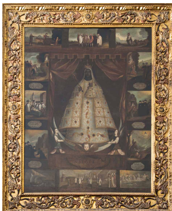
Fig. 3. Virgen de Guadalupe, anónimo, primera mitad de s. XVII, óleo sobre lienzo, Iglesia de San Agustín, Bogotá.

Existe otra variante del tema de los verdaderos retratos que junto a la real de la escultura mariana, incorpora esa otra realidad trascendente de lo divino en la zona baja, es decir, la presencia de ciertos santos escogidos según la preferencia del mecenas que acompañan espiritualmente a la virgen. Así, en el cuadro que conserva el Seminario Mayor de Bogotá vemos como compañía de la Virgen a dos santos de fuerte raigambre americana: San Nicolás Tolentino, identificable por la perdiz y el hábito estrellado, y San Francisco Javier, con capelina y hábito jesuita de cuello alto que abre para mostrar la espina de su corazón. Otro ejemplo de esta vertiente es el que se encuentra en el antiguo convento de Santa Clara la Real de Tunja, en el que aparecen San Juan Bautista y un santo papa en actitud orante.