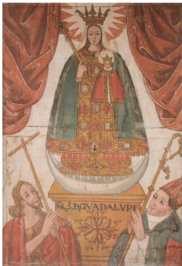
Fig. 7. Virgen de Guadalupe, anónimo, ss. XVI-XVII, pintura al temple sobre lienzo, Convento de Santa Clara la Real, Tunja.

Citamos para terminar la existencia de otras vírgenes extremeñas en Colombia cuyo análisis no tiene cabida en este trabajo: las anónimas bogotanas del convento de Santa Clara, de la Recoleta de San Diego así como la atribuida al venezolano Juan Pedro López (1724-1787), que podemos insertar dentro de la órbita del arte neogranadino del momento. Hasta aquí estos breves apuntes que quizá puedan servir para indagaciones futuras.