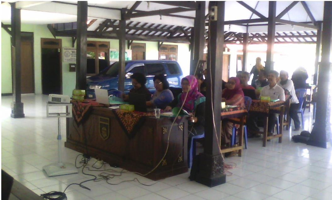
Foto pelaksanaan pengabdian kepada masyarakat