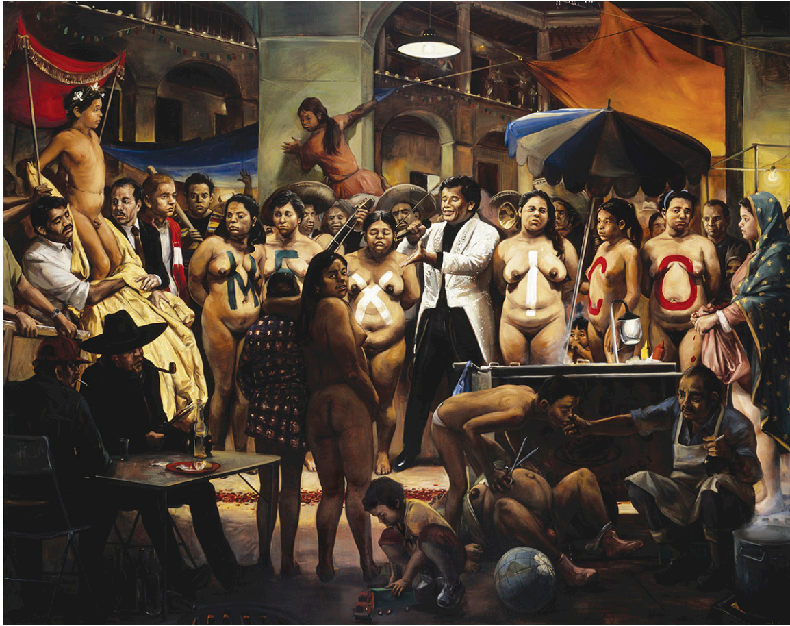
4. La gran noche mexicana (2005) Óleo sobre lino, 240 x 320 cm. Colección Gunter Rohde, Puebla, Puebla.