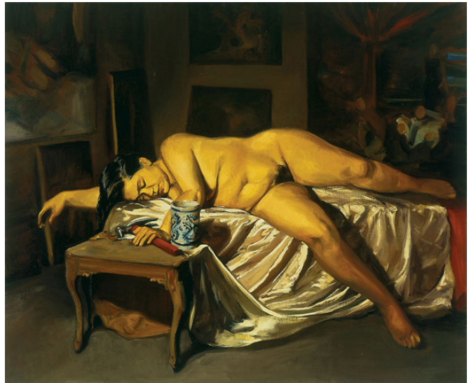
1. Alexiara en el taller (2000). Óleo sobre algodón, 80 x 100 cm. Hermes Trust Collection, Nueva York. Recuperada del Catálogo de exposición (2008). Daniel Lezama: la madre pródiga . México: Hilario Galguera ediciones.

Frente al espectador, una mujer dormida recostada al parecer sobre un mueble cubierto con una tela se encuentra en un lugar que por los objetos que la rodean es el estudio del pintor. Su cabellera oscura y el tono de piel morena clara alude a las características físicas de la población del país donde el 64 por ciento de los mexicanos se considera moreno 4 . Se trata de un cuerpo relajado, ensoñador, que invita a la contemplación de las posibilidades de modelar en la pintura contemporánea un cuerpo exuberante en reposo.