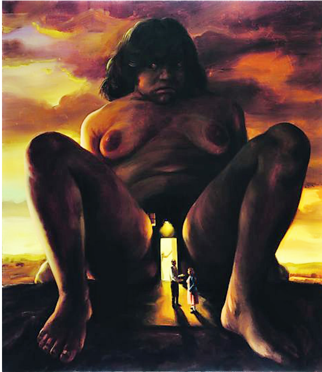
3. Adolescente personificando una casa (2000). Óleo sobre algodón, 150 x 130 cm. Colección particular, Ciudad de México. Recuperada del Catálogo de exposición (2008). Daniel Lezama: la madre pródiga . México: Hilario Galguera ediciones.

Otro ejemplo es La gran noche mexicana (2005) (Fig. 4), en la cual la mayoría de las mujeres están desnudas con letras pintadas en sus vientres que forman la palabra México , incluyendo a una embarazada que yace sobre el suelo a punto de dar a luz y de la que sólo se observa sus ojos cerrados, la boca entreabierta (quizá en señal del dolor de parto), uno de sus senos, su vientre abultado, su piernas entreabiertas y sus pies cubiertos por unas medias. Un adolescente que sólo viste una trufa blanca es alentado con un suave gesto en la mejilla por un hombre con un mandil, en espera de cortar el cordón umbilical con unas tijeras quirúrgicas.