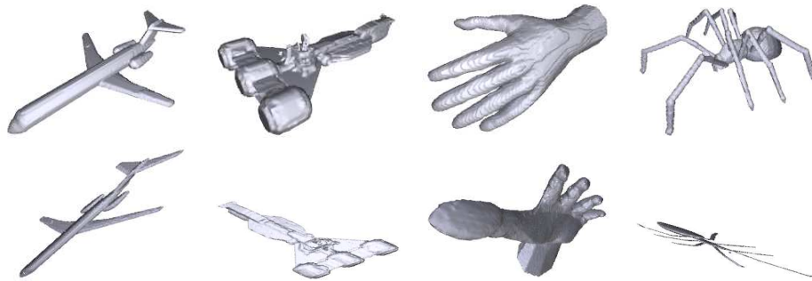
1. ábra: Példák a képi adatbázisból: sablon objektumok (felül) és affin módon deformált megfigyelt képek (alul).

Matlab 7.7 alatt implementáltuk, és egy 2.4 GHz-es Intel Core2 Duo processzorral rendelkező asztali számítógépen futtattuk.