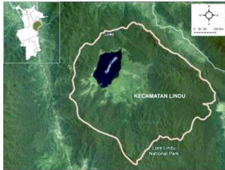
Gambar 1. Peta Penelitian

Sampel ikan sidat diambil di Danau Lindu Kecamatan Lindu, Kabupaten Sigi dan ikan sidat diperiksa di Laboratorium Helminthologi, Fakultas Kedokteran Hewan, IPB University. Koleksi ikan di Danau Lindu dilaksanakan pada bulan Juli sampai Agustus 2014 dan pemeriksaan ikan sidat mulai dari bulan September sampai November 2014. Penelitian ini menggunakan analisis deskriptif dengan pendekatan simple random .