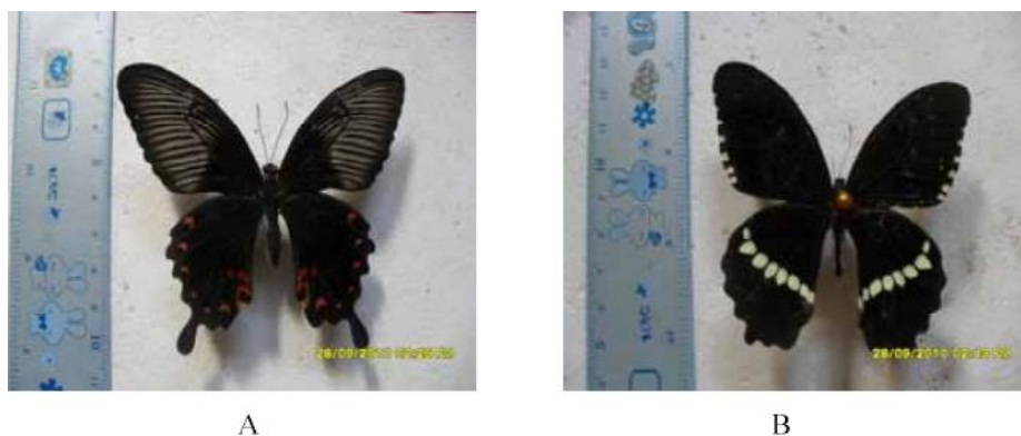
Gambar 5. Imago Papilio polytes , A). betina, B). jantan

Papilio polytes memiliki permukaan sayap bewarna hitam, terdapat bintik bewarna kuning pada daerah marginal sayap atas dan discal sayap belakang. Pada daerah submarginal permukaan bawah sayap belakang terdapat bintik merah bewarna orange. Terdapat perpanjangan sayap belakang pada vena ke empat sehingga tampak menyerupai ekor. Menurut Salmah, et. al. (2002) permukaan sayap bewarna coklat kehitaman, daerah marginal sayap atas dan daerah discal sayap belakang mempunyai sederet bintik kuning. Pada permukaan bawah sayap belakang terdapat bintik bewarna oranye. Vena keempat sayap belakang mengalami perpanjangan seperti ekor. Kupu-kupu Papilio polytes yang didapat dari hasil penelitian berjumlah 12 ekor dan semuanya berjenis kelamin betina.