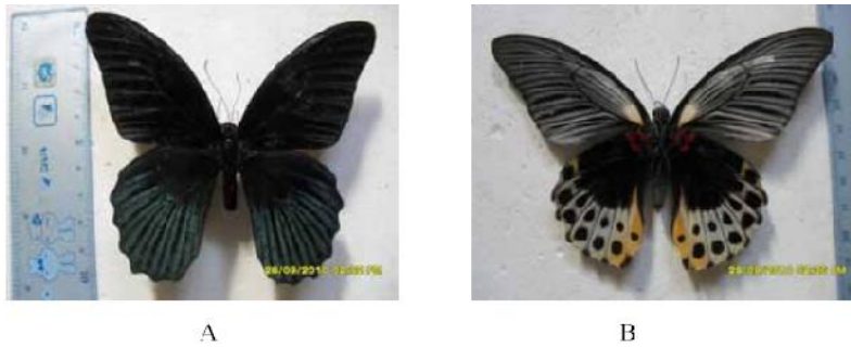
Gambar 6. Imago Papilio memnon , A). jantan, B). betina

Papilio memnon jantan memiliki sayap dominan berwarna hitam baik itu permukaan atas dan belakang sayap dan pada bagian sub apical, sub marginal, dan tornus terdapat sisik-sisik berwarna biru yang berkilau. Pada bagian basal terdapat warna merah. Terdapat bercak bergaris berwarna abu-abu pada bagian discal hingga sub marginal sayap bagian depan dan terdapat pula titik-titik hitam. Kupu-kupu betina memiliki beberapa tipe, venasi sayap berwarna hitam pada daerah basal sayap berwarna merah, putih dan hitam. Terdapat sisik-sisik putih dan hitam disepanjang venasi sayap daerah discal sampai marginal dan apical. Pada sayap belakang daerah basal berwarna merah dan hitam, daerah discal berwarna merah, putih, dan kuning sedangkan daerah sub marginal berwarna hitam. Menurut Salmah, et. al (2002) kupu-kupu jantan permukaan sayap berwarna hitam, pada daerah sub marginal, sub apical, sampai ke marginal dan apical terdapat sisik halus berbentuk garis berwarna biru yang menyebar disepanjang vena. Permukaan sayap bawah berwarna hitam, pada daerah basal terdapat warna merah. Bagian discal sampai marginal dan apical sayap depan mempunyai sisik halus bergaris berwarna abu-abu. Kupu-kupu betina mengalami polimorfisme. Venasi sayap berwarna hitam, pada daerah basal sayap atas berwarna merah putih dan hitam sayap belakang daerah basal berwarna hitam dan