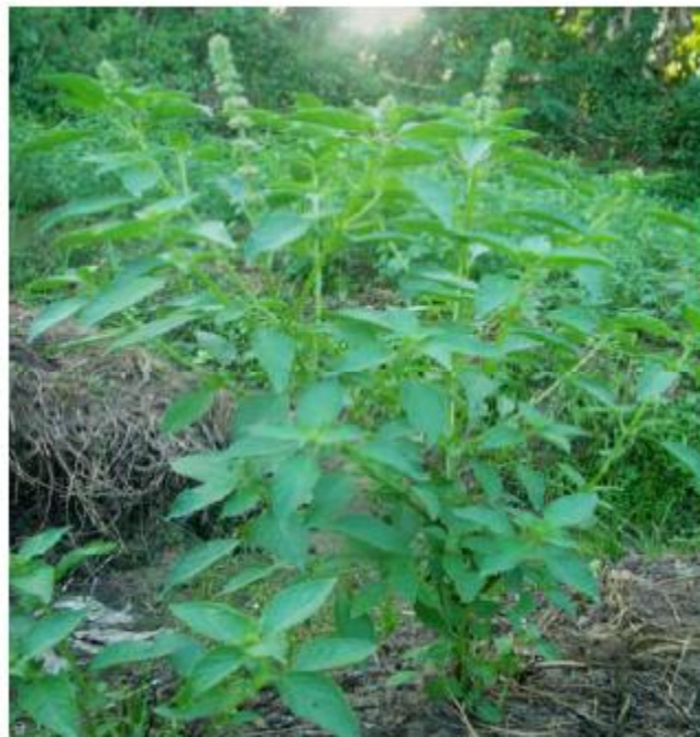
Kemangi ( Ocimum basilicum L.) doc. Rosy