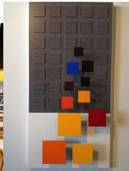
Фиг.2. Пространство символично