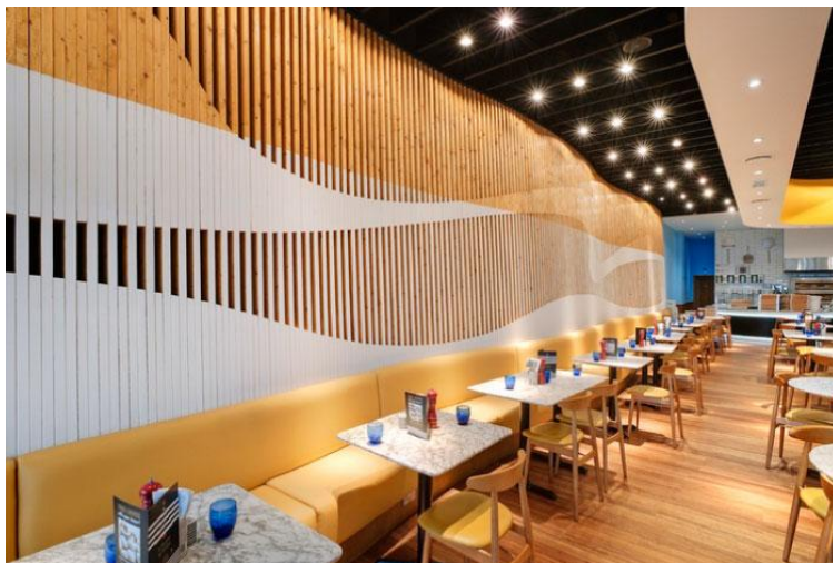
Фиг.1. Пространство в интериор

Факторите за отворената форма (материал, средства, енергия), по-специално във визуално изкуство (архитектура , статуи , дизайн) , външната форма показва, че може да се види. Затова осъзнаването на изкуството е възвишено, а може да се каже и външната форма като основен фактор на човешкото общуване в пространството и формите в него.