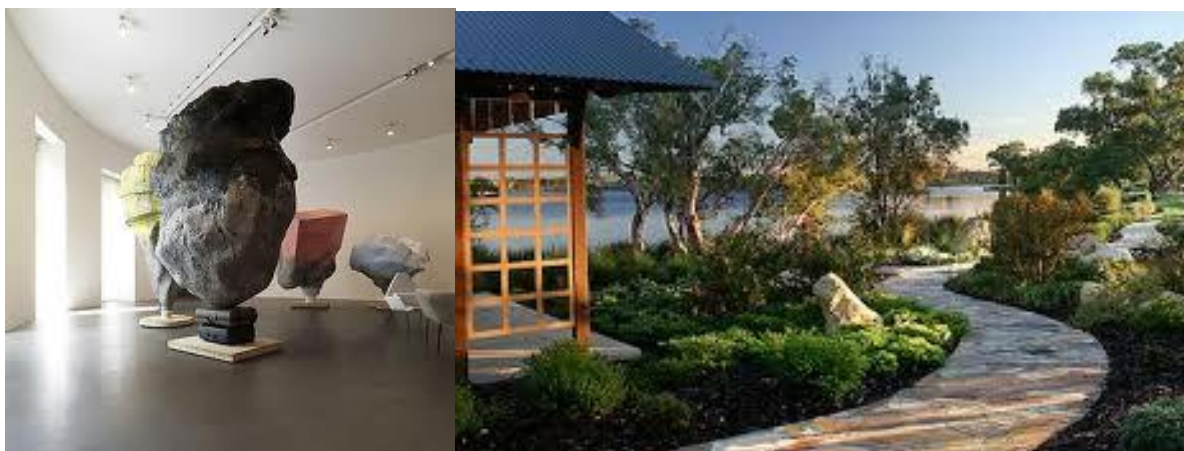
Фиг.3 Пространство като скулптура 4.Пространство в открито пространство