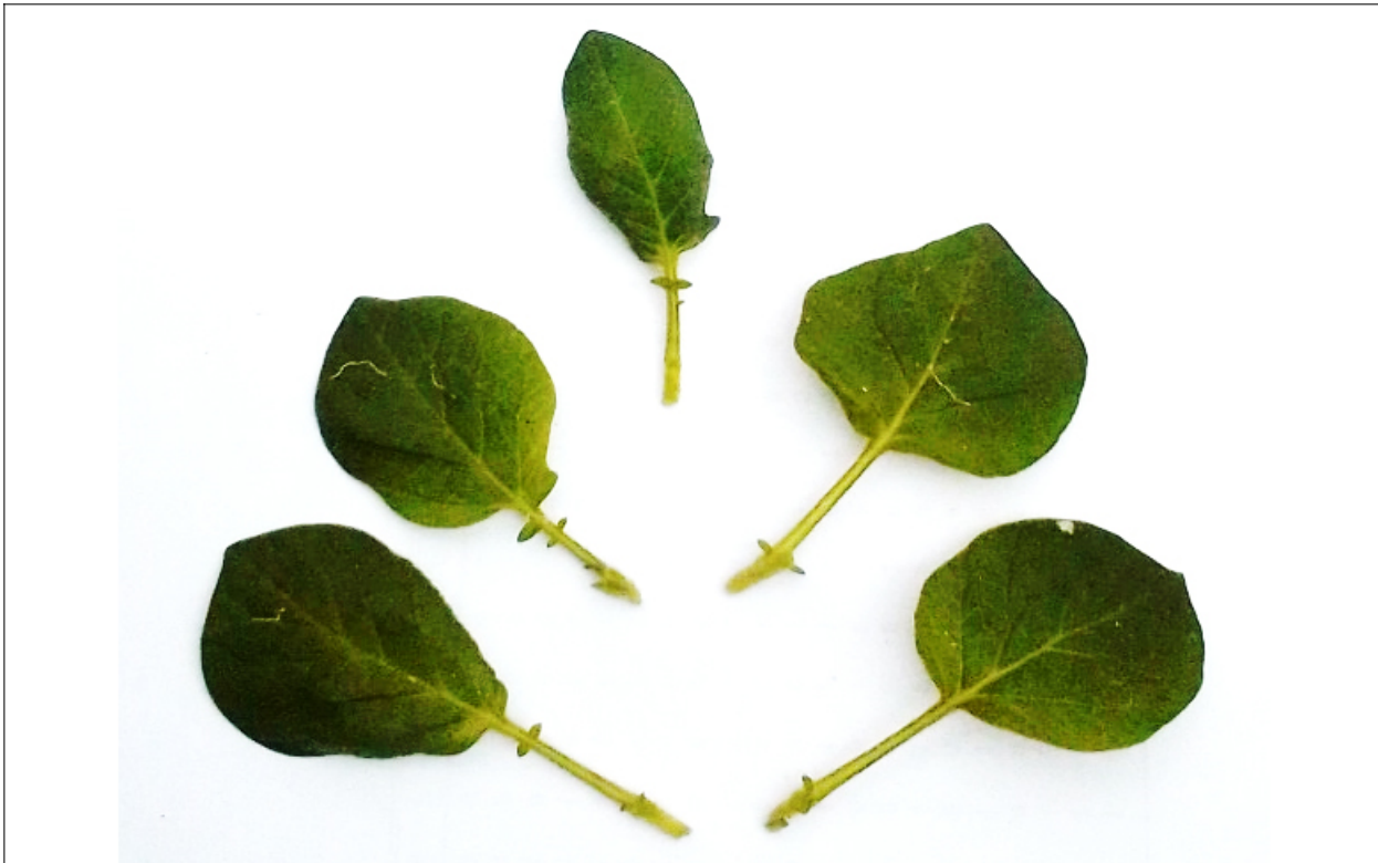
Figura 1. Esqueje de tallo juvenil de Solanum tuberosum var. yungay .