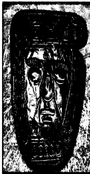
Златна маска: VI-V век п.н.е. Требеништа - Охрид

Информации, резервации и пријави за учество: На адреса: Македонско лабораториско здружение Ул. Никола Паралунев ДТЦ 4/7, 1000 Скопје, Р.Македонија, Тел./факс ++ 389 2 2037012, контакт тел. ++ 389 70639 816 Е-маил: млзлабораторија@звх.орг.мк